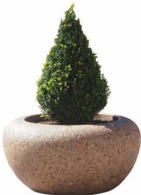
▲ Pflanzbehälter VENERE aus Marmor gestockt, in porphy

ZIEGLER Tel +43 (0) 76 72 / 9 58 95 | Fax +43 (0) 76 72 / 9 58 95 14 | info@ziegler-metall.at