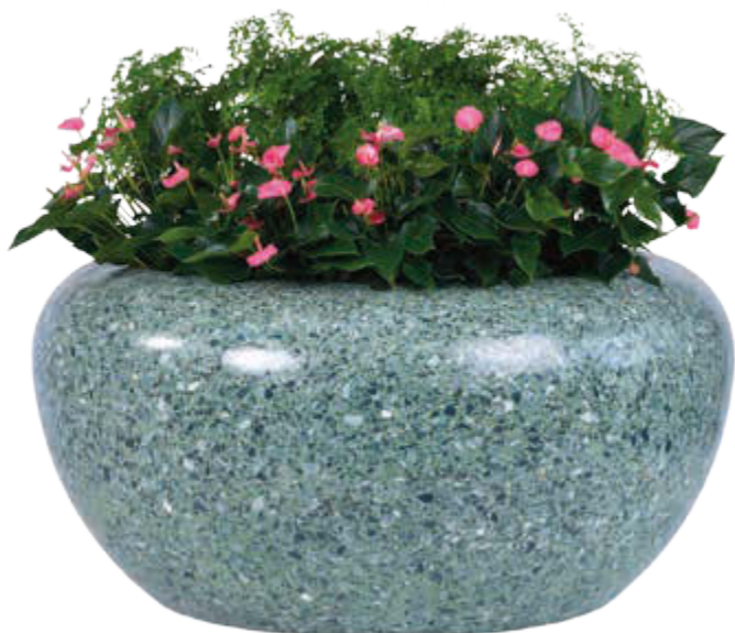
◀ Pflanzbehälter GIOVE aus Marmor geschliffen, in grün alpi