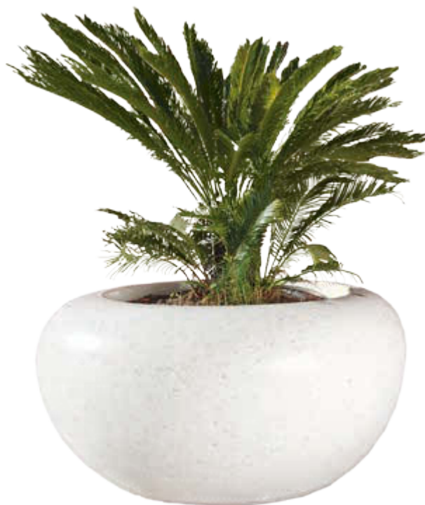
▲ Pflanzbehälter VENERE aus Marmor geschliffen, in weiß carrara