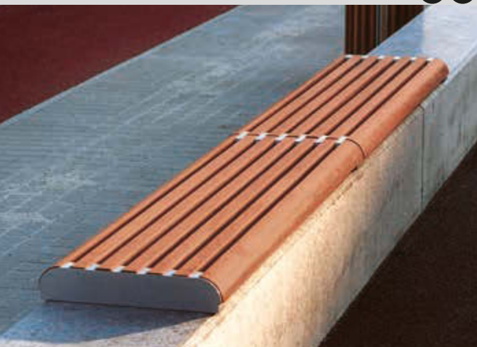
Mauerauflage FORMA mit Jatobaholzbelattung, Stahlteile in RAL 9007 graualuminium

Passende Sitzbänke FORMA finden Sie auf Seite 346.