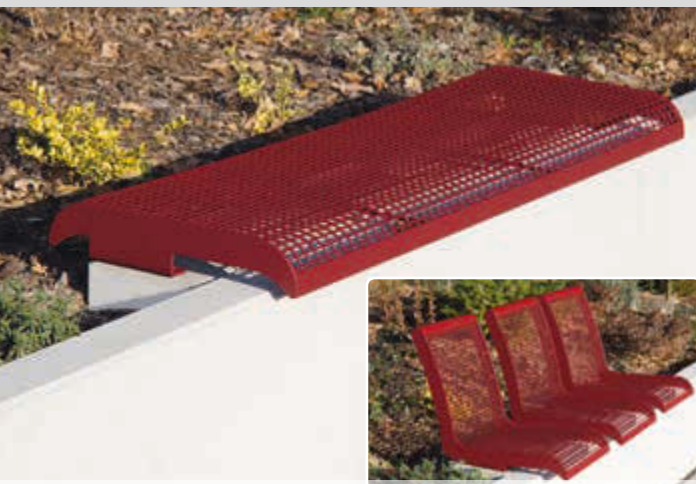
Mauerauflage LINUS, Sitzbank ohne Rückenlehne, in RAL 3005 weinrot