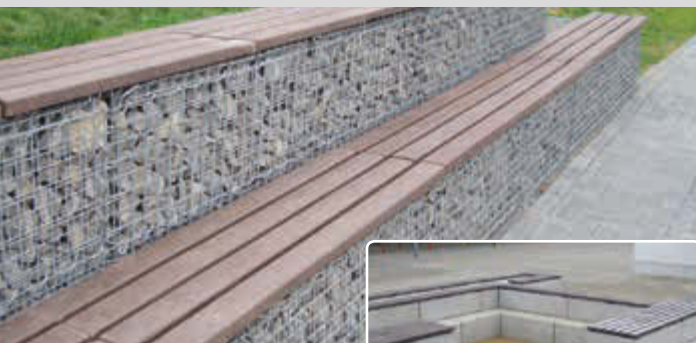
▲ Gabionenauflage UDINE mit 4 Banklatten

► auf Anfrage als Mauerauflage UDINE in verschiedenen Ausführungen