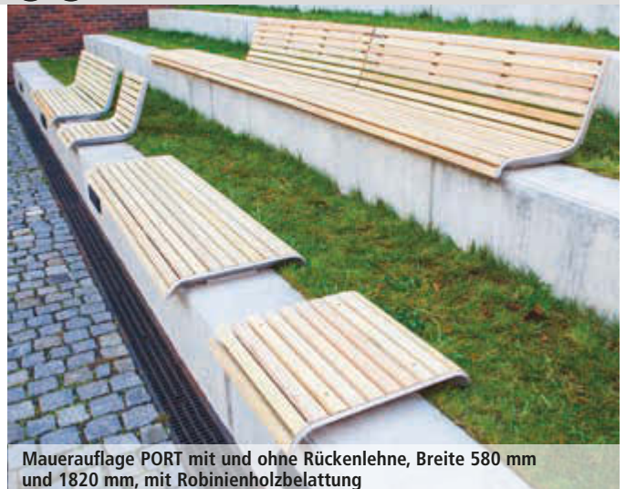
Mauerauflage PORT mit und ohne Rückenlehne, Breite 580 mm und 1820 mm, mit Robinienholzbelattung