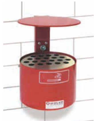
▲ Rundascher KERRY mit Schutzdach, Wandbefestigung, in RAL 3002 karminrot