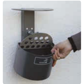
▲ Entleerung von Halbrundascher KERRY mit Schutzdach, Wandbefestigung, in DB 703 eisenglimmer

Besonderheit: Für kundenseits vorhandene Pfosten empfehlen wir zur Befestigung die universalen Schellenbänder, siehe Zubehör.