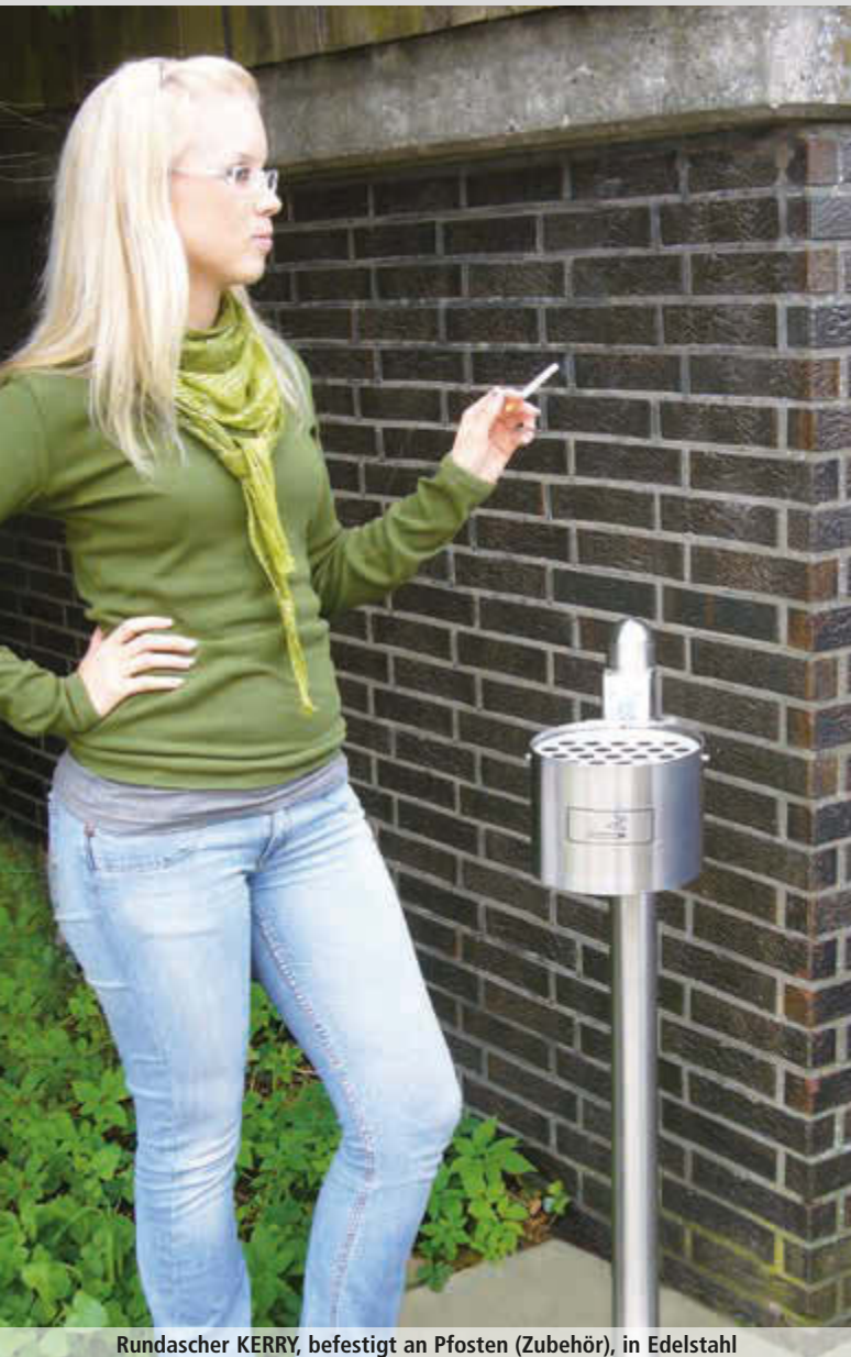
Rundascher KERRY, befestigt an Pfosten (Zubehör), in Edelstahl