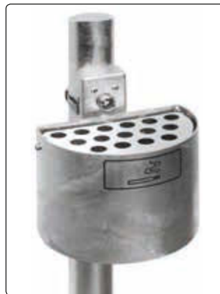
▲ Halbrundascher KERRY, befestigt an Pfosten (Zubehör), feuerverzinkt