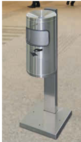
▲ Abfallbehälter GLASGOW mit Ascher, aus Edelstahl, mit Standfuß zum Aufdübeln (Zubehör)