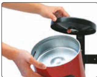
◀ Entleerung vom Abfallbehälter GLASGOW mit Ascher, in RAL 3001 signalrot, zur Wandbefestigung