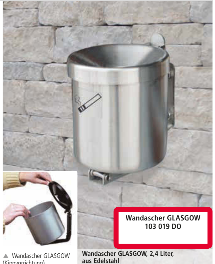
Wandascher GLASGOW 103 019 DO