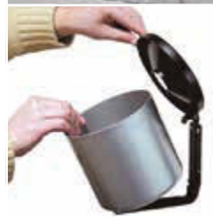
▲ Wandascher GLASGOW (Kippvorrichtung)