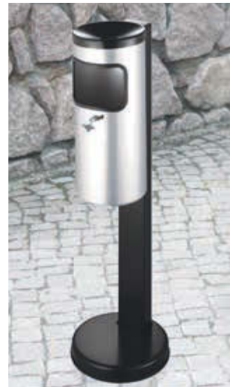
▲ Abfallbehälter GLASGOW mit Ascher, in weißaluminium ähnlich RAL 9006, mit Standfuß zum freien Aufstellen (Zubehör)

Wandascher GLASGOW mit Zylinderschloss finden Sie online unter: www.ziegler-metall.at/glasgow