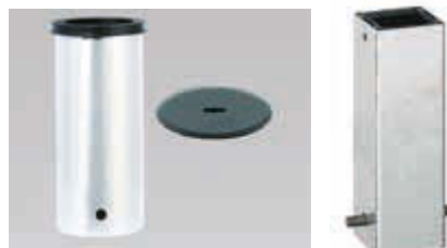
▶ Bodenhülsen für Sperrpfosten