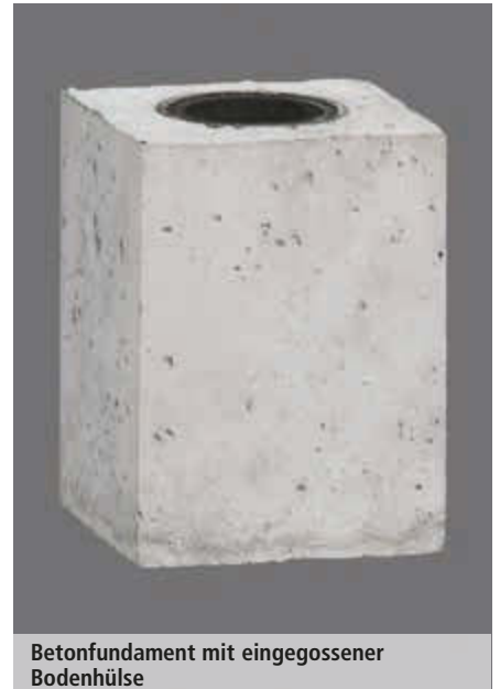
Betonfundament mit eingegossener Bodenhülse