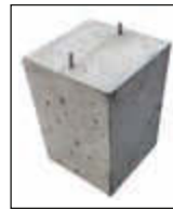
▲ Betonfundament mit eingegossenem Bodenanker