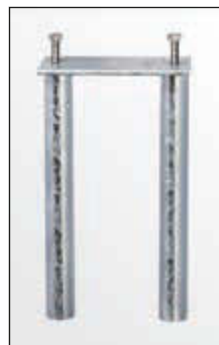
◀ Bodenanker für alle kippbaren Sperrpfosten mit einer Bodenplatte 200 x 100 mm