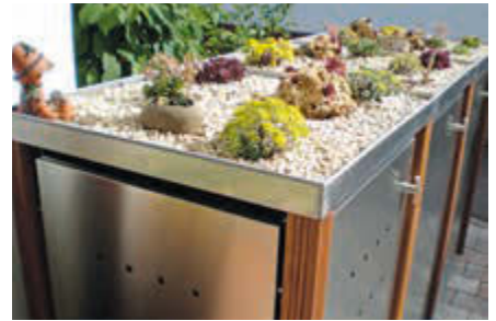
▲ Pflanzdach in Edelstahl mit Dachbegrünung