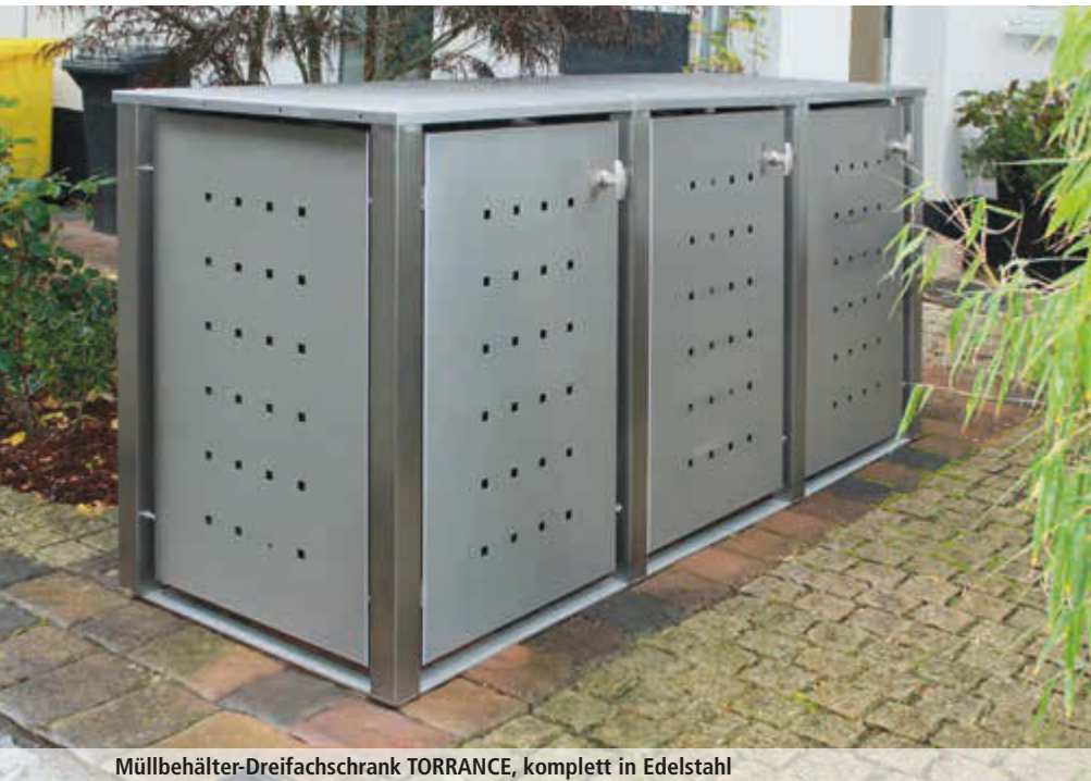
Müllbehälter-Dreifachschränk TORRANCE, komplett in Edelstahl