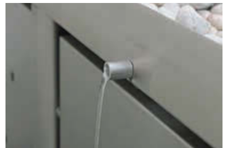
▲ Detail: Ablaufröhrchen nach außen (hinten)