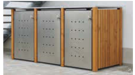
▲ Müllbehälter-Dreifachschrank FONTANA, Türen und Dach aus Edelstahl, Pfosten, Rück- und Seitenwandelemente aus Lärchenholz