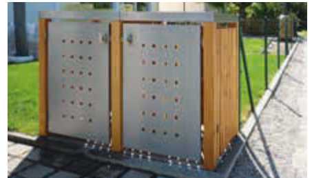
▲ Müllbehälter-Doppelschrank FONTANA, Türen und Dach aus Edelstahl, Pfosten, Rück- und Seitenwandelemente aus Lärchenholz