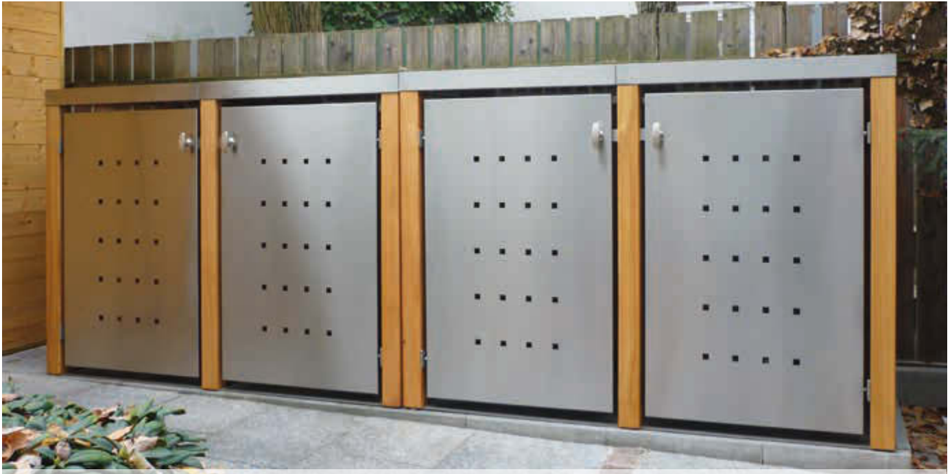
2x Müllbehälter-Doppelschrank FONTANA, Türen und Dach aus Edelstahl, Pfosten, Rück- und Seitenwandelemente aus Lärchenholz