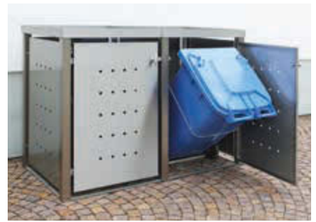
▲ Müllbehälter-Doppelschränk TORRANCE, komplett in Edelstahl, mit Kippvorrichtung