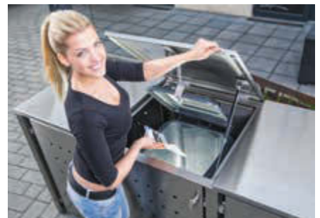
▲ Klappdach mit Gasdruckdämpfer