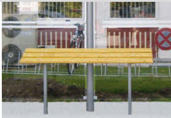
Anlehnbank SMOKY, Lehne mit Sapeliholzbelattung, pulverbeschichtet in DB 703 eisenglimmer

Konstruktion: Anlehnbank bestehend aus Rundrohrstützen und abfallender Sitzfläche mit Holzbelattung.