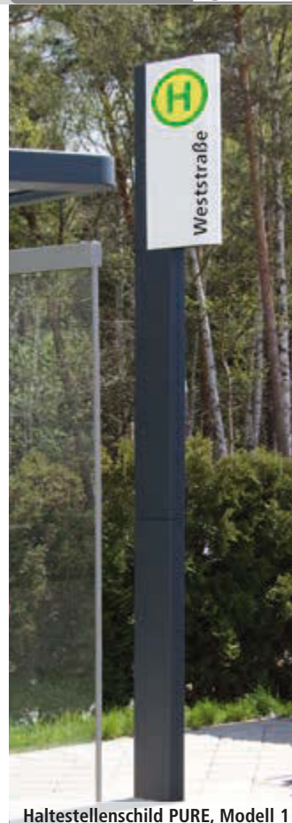
Haltestellenschild PURE, Modell 1