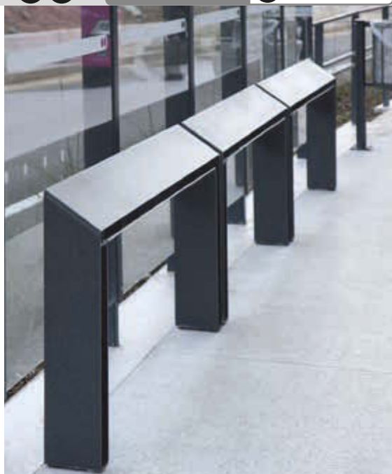
Anlehnbank RADIUM, 1000 mm breit, in RAL 9005 tiefschwarz

Konstruktion: Anlehnbank aus Flachstahl.