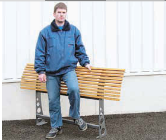
Anlehnbank RELIEF, Lehne mit Escheholzbelattung, 1700 mm breit, pulverbeschichtet in DB 703 eisenglimmer

Konstruktion: Stahlseitenteile mit dekorativen Ausschnitten. Lehne mit Holzbelattung bzw. Rundstahl Ø 8 mm.