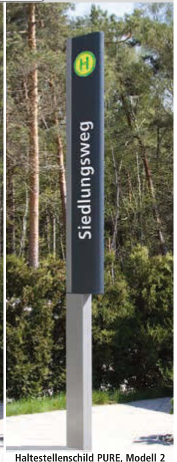
Haltestellenschild PURE, Modell 2