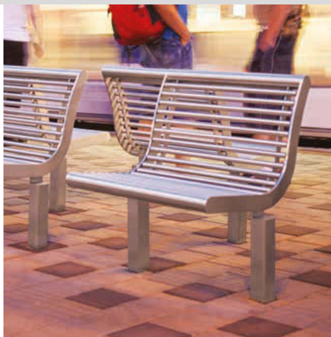
Sitz DIVA SOLO mit Rückenlehne, Auflage und Unterkonstruktion Edelstahl