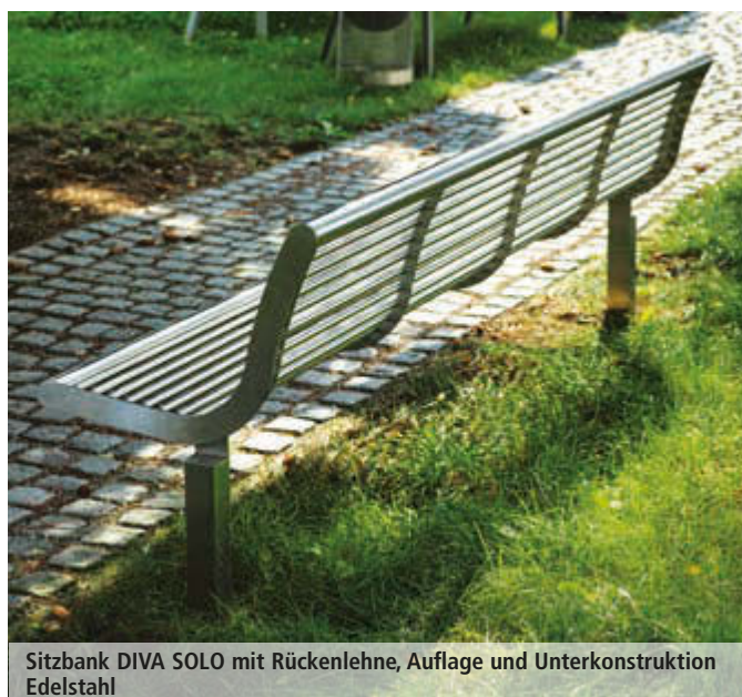
Sitzbank DIVA SOLO mit Rückenlehne, Auflage und Unterkonstruktion Edelstahl