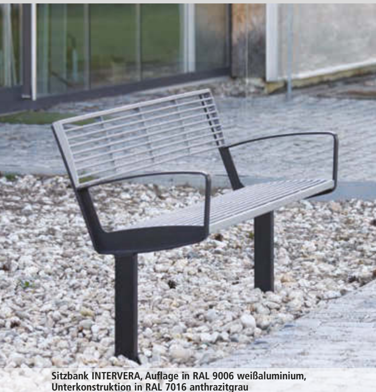
Sitzbank INTERVERA, Auflage in RAL 9006 weißaluminium, Unterkonstruktion in RAL 7016 anthrazitgrau