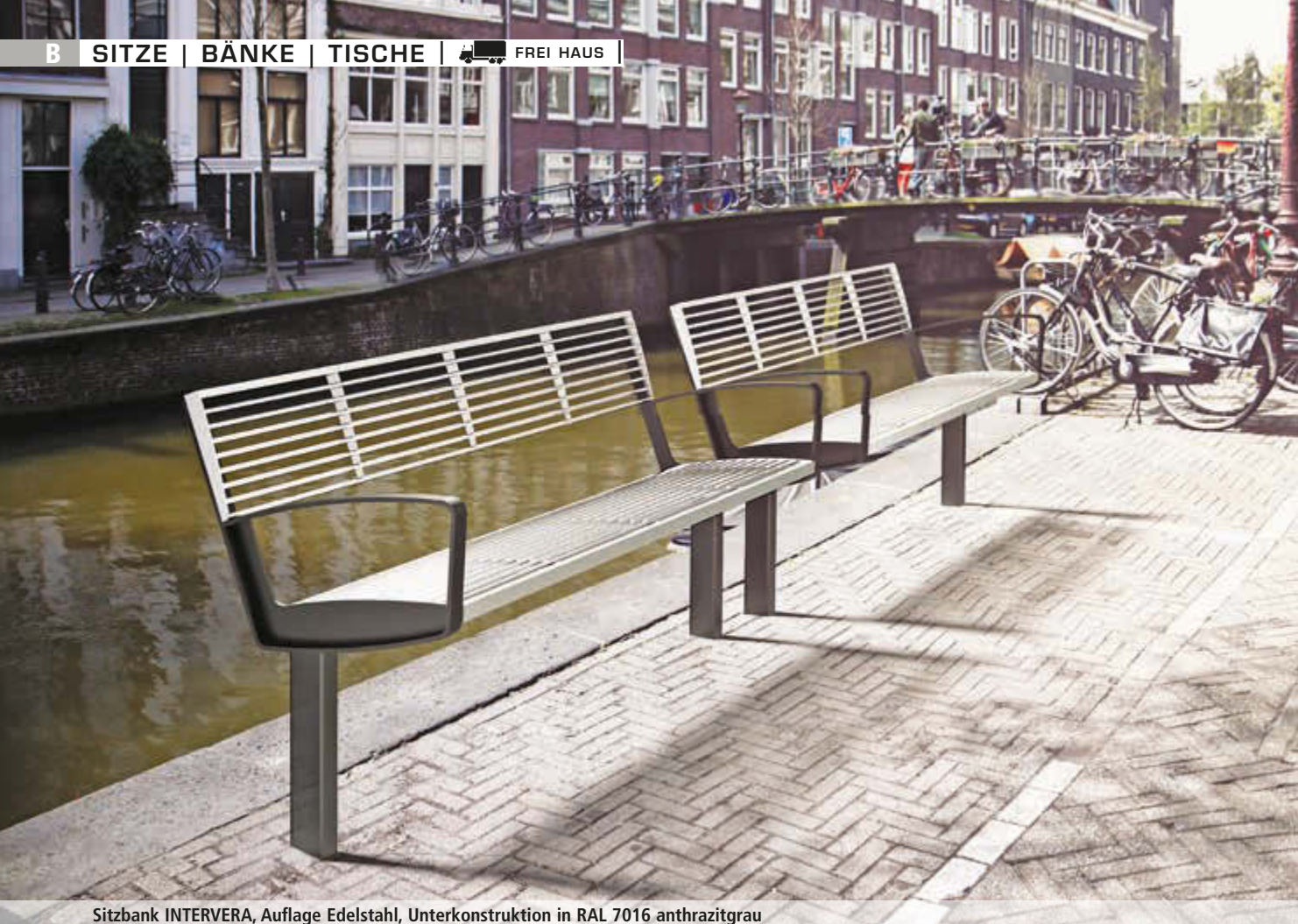
Sitzbank INTERVERA, Auflage Edelstahl, Unterkonstruktion in RAL 7016 anthrazitgrau