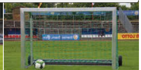
Mini-Tor PROTECTION, Höhe 1200 mm