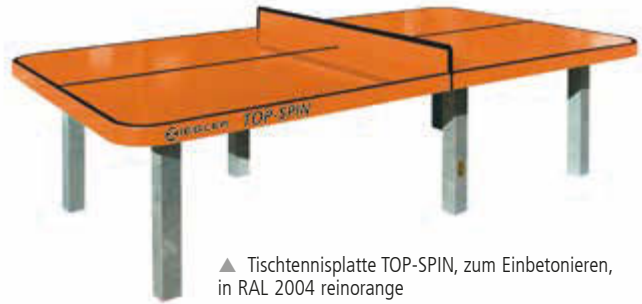
▲ Tischtennisplatte TOP-SPIN, zum Einbetonieren, in RAL 2004 reinorange

Anlieferung: Erfolgt zerlegt auf Palette, inkl. Montageanleitung.