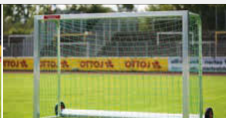
Mini-Tor SAFEGUARD, Höhe 1600 mm