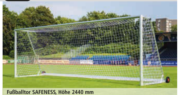
Fußballtor SAFENESS, Höhe 2440 mm