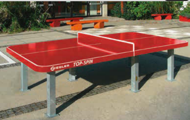
Tischtennisplatte TOP-SPIN, zum Aufdübeln, in RAL 3000 feuerrot