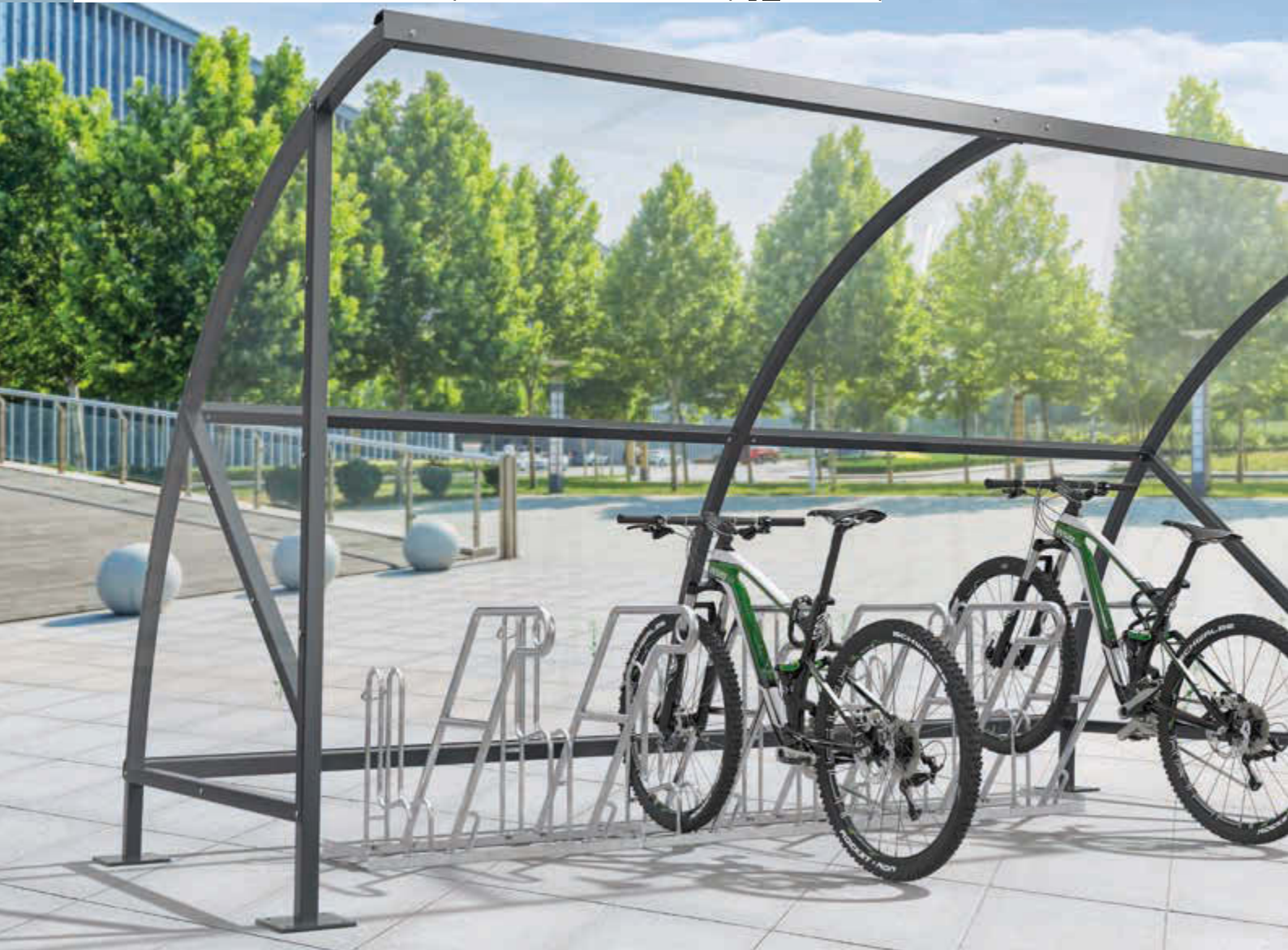
Fahrradüberdachung CEPHEUS, Dachbreite x Dachtiefe 4130 mm x 2100 mm, Dach und Seitenwände aus Polycarbonat, Fahrradständer RIVERSIDE, Stahlkonstruktion in RAL 7016 anthrazitgrau