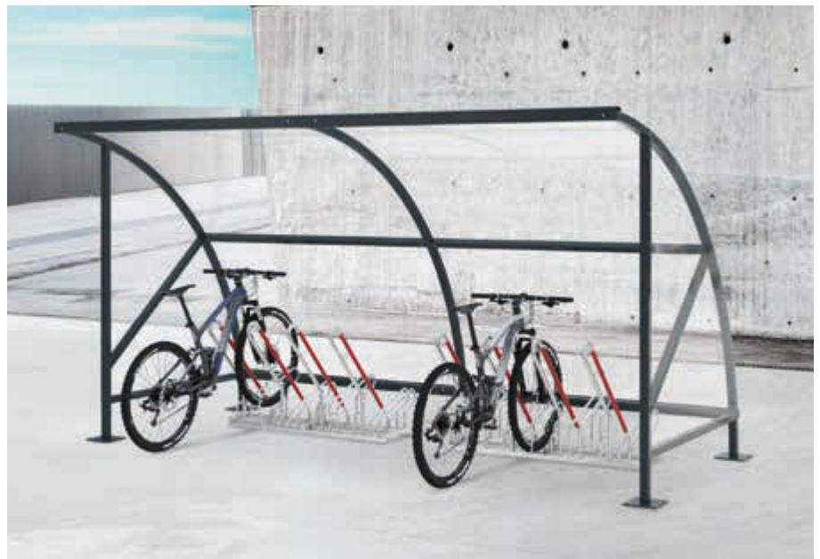
Fahrradüberdachung CEPHEUS, Dachbreite x Dachtiefe 4310 mm x 2100 mm, Dach und Seitenwände aus Polycarbonat, Fahrradständer NEW YORK, Stahlkonstruktion in RAL 7016 anthrazitgrau