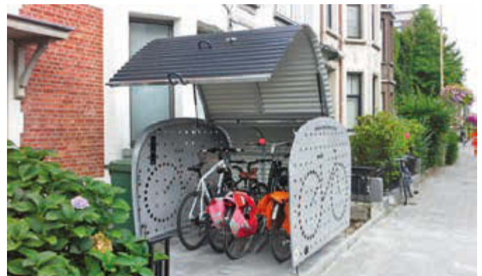
Fahrradgarage VELO-BOXX®-Professional mit Klappflügeltür aus Wellblech in RAL 7016 anthrazitgrau, Seitenwände in RAL 7004 signalgrau