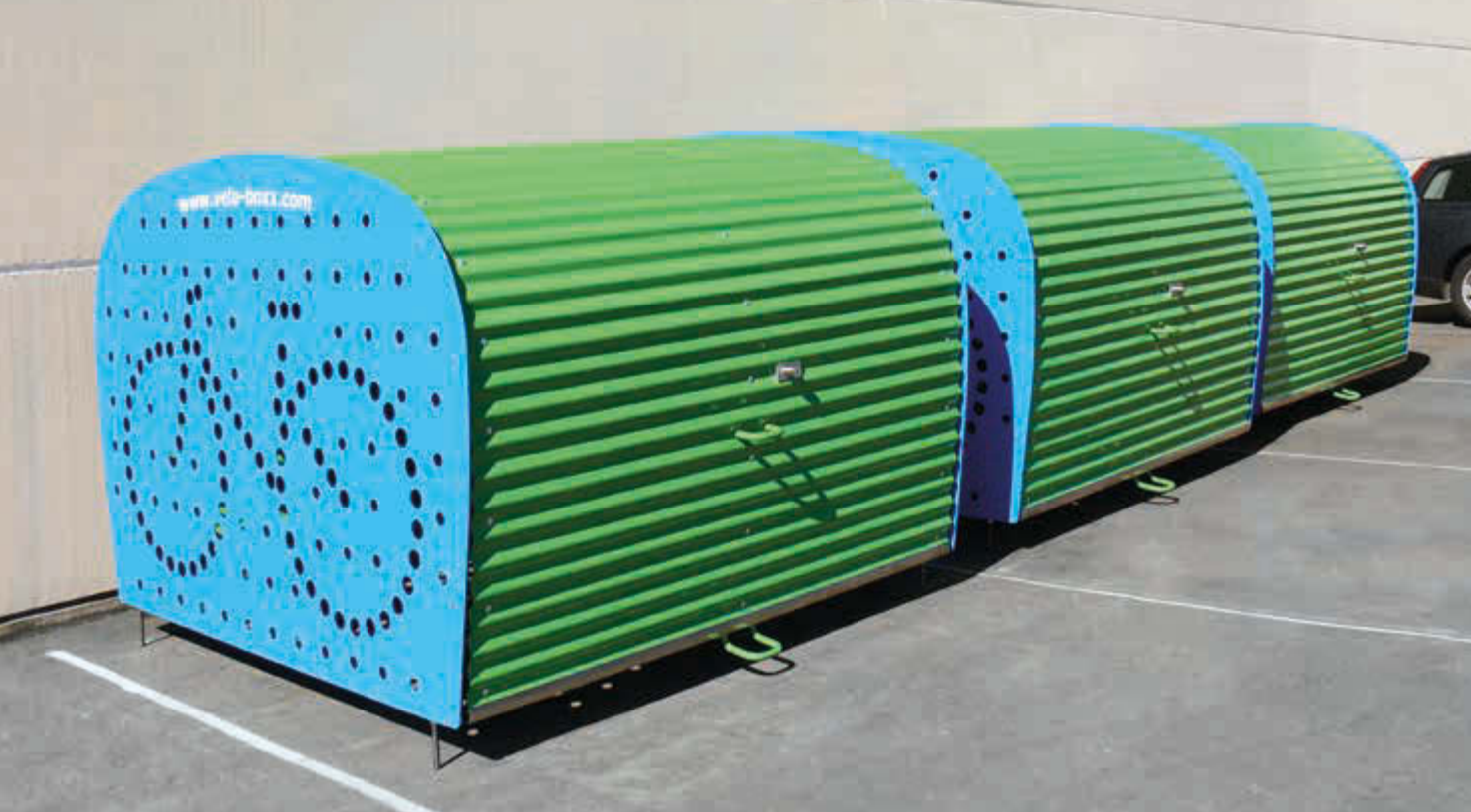
Fahrradgarage VELO-BOXX®-Professional mit Klappflügeltür aus Wellblech in RAL 6018 gelbgrün, Seitenwände in RAL 5012 lichtblau (auftragsbezogene Pulverbeschichtung)