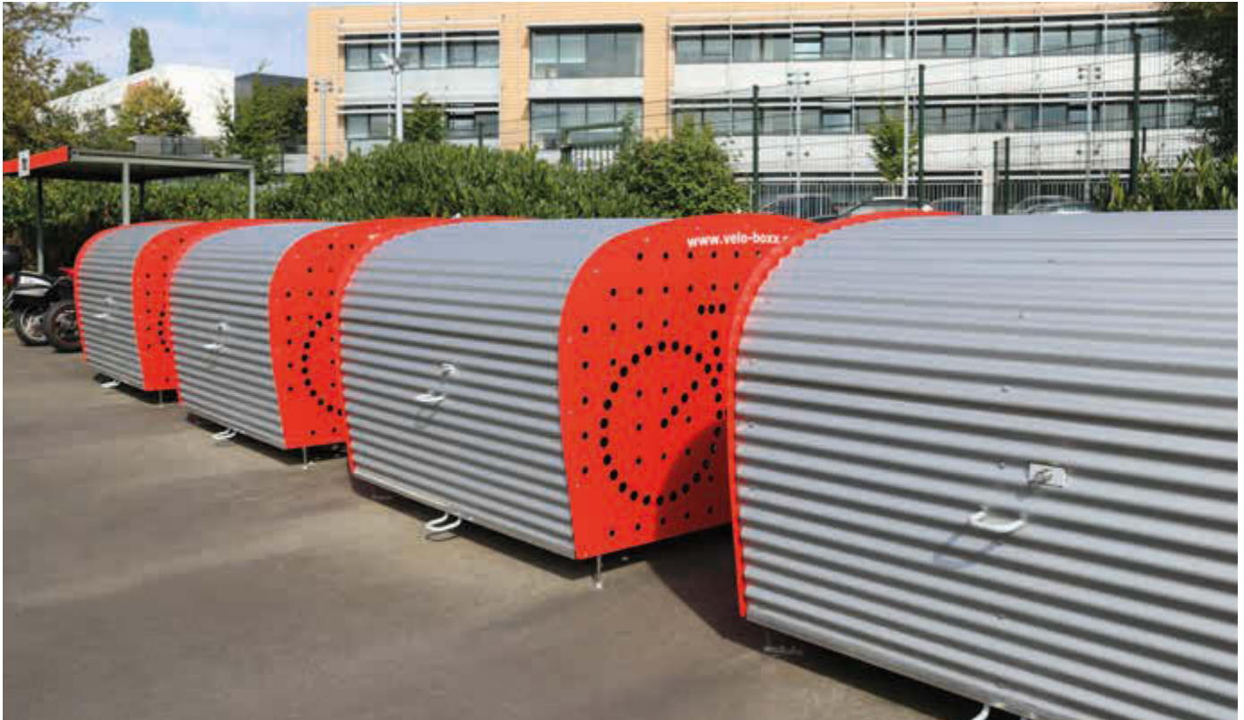
Fahrradgarage VELO-BOXX®-Professional mit Klappflügeltür aus Wellblech in RAL 9007 grau-aluminium, Seitenwände in RAL 3000 feuerrot (auftragsbezogene Pulverbeschichtung)

Standardfarben Klappflügeltür und Rückwand - bitte bei Bestellung Farbe angeben!