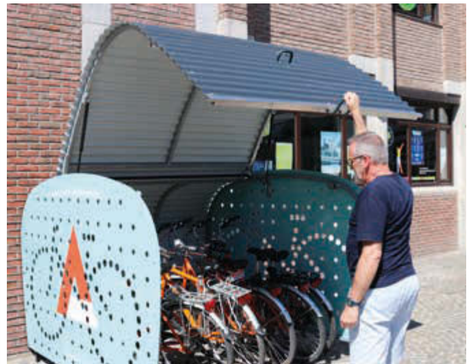
Fahrradgarage VELO-BOXX®-Professional mit Klappflügeltür aus Wellblech in RAL 7016 anthrazitgrau, Seitenwände in RAL 7001 silbergrau (auftragsbezogene Pulverbeschichtung), Werbefolie bauseitig