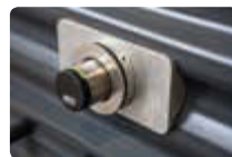
▲ Detail: Elektronisches Schließsystem