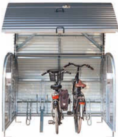
▲ Fahrradgarage VELO-BOXX®-Professional mit Klappflügeltür aus Wellblech in RAL 7016 anthrazitgrau, Seitenwände in RAL 7004 signalgrau, inklusive Einbau-Fahrradständer