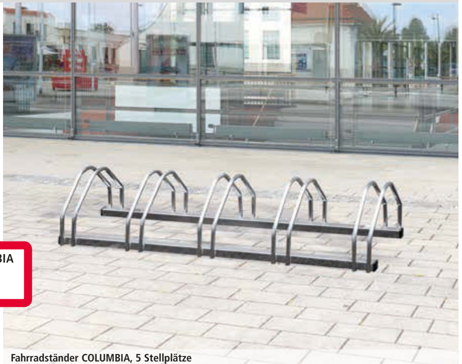
Fahrradständer COLUMBIA, 5 Stellplätze

Fahrradständer COLUMBIA 734 011 DT € 102,80