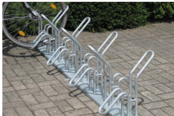
Reihenfahrradständer HERVEY doppelseitig, 90°, tief, 8 Stellplätze