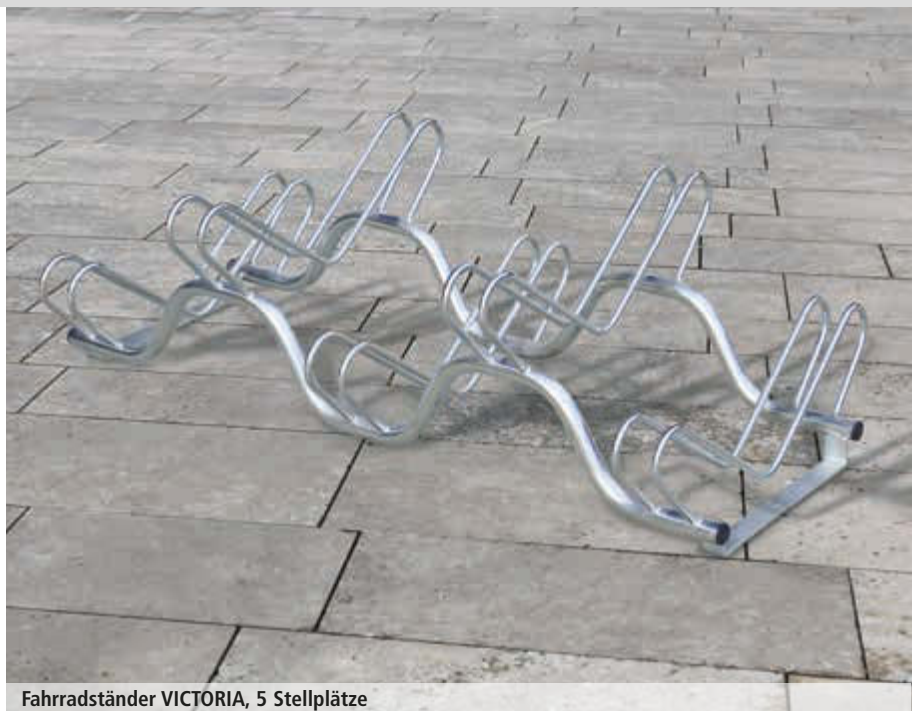
Fahrradständer VICTORIA, 5 Stellplätze