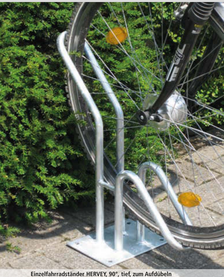
Einzelfahrradständer HERVEY, 90°, tief, zum Aufdübeln

Konstruktion: Stabile Stahlkonstruktion. Radhalterung aus einem Stück gebogen, Rundrohr (Ø 20 mm). Einstellwinkel 45° und 90°. Einzelfahrradständer in Einstellung tief bzw. hoch, Reihenfahrradständer in tief bzw. hoch / tief. Radeinstellung 45° und 90°.