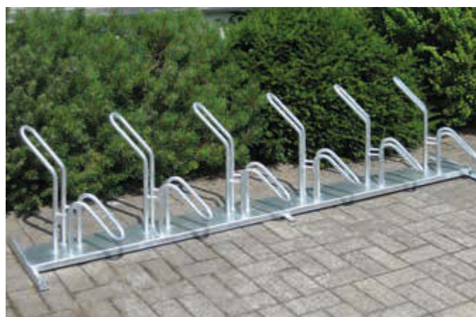
Reihenfahrradständer HERVEY einseitig, 45° rechts, 6 Stellplätze