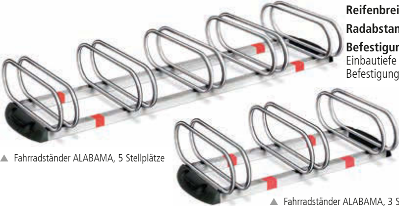
▲ Fahrradständer ALABAMA, 5 Stellplätze

Fahrradständer ALABAMA 483 040 DT € 202,10