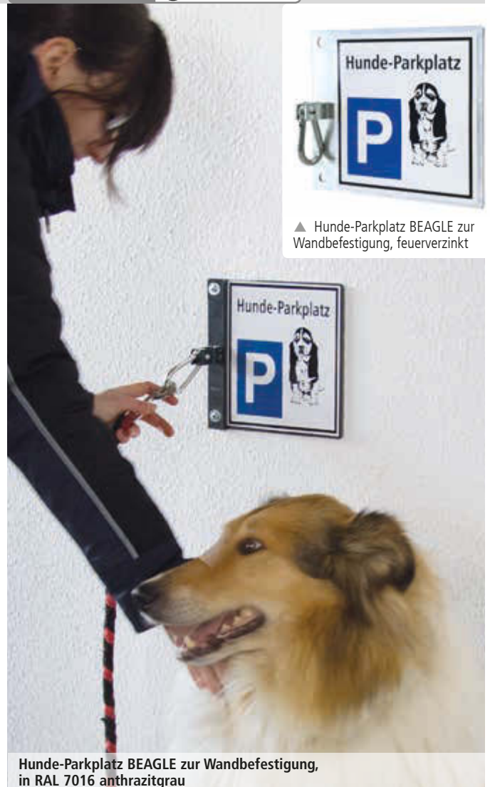
▲ Hunde-Parkplatz BEAGLE zur Wandbefestigung, feuerverzinkt