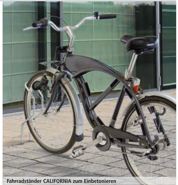
Fahrradständer CALIFORNIA zum Einbetonieren