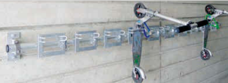
Reihenanlage Scooter-Parker CHARLOTTE bestehend aus 3 Montageplatten und Querrohr 2750 mm, 10 Stellplätze

Konstruktion: Robuste, gekantete feuerverzinkte Stahlblech-konstruktion. Einzeln zur Wandmontage oder mit Unterkonstruktion bestehend aus Querrohr mit Nuten (Ø 48 mm), mit stirnseitigen Montageplatten und Montagekonsolen nach Wahl für Boden, Wand oder zum freien Aufstellen.