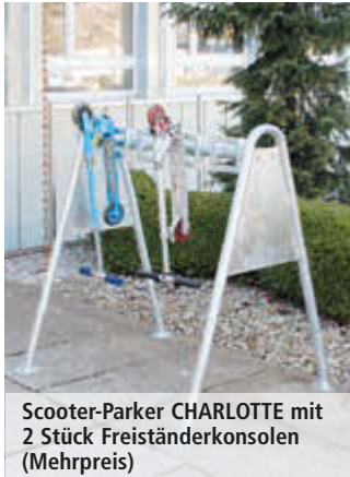
Scooter-Parker CHARLOTTE mit 2 Stück Freiständerkonsolen (Mehrpreis)