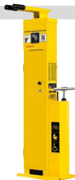
▲ Servicestation ASSIST, Modell „PREMIUM“