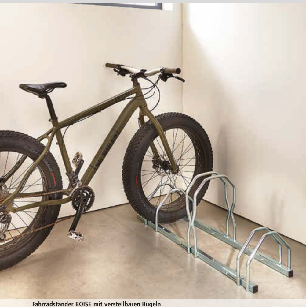
Fahrradständer BOISE mit verstellbaren Bügeln

Konstruktion: Stabile Stahlkonstruktion (30 x 30 mm) mit stets verstellbaren Bügeln (Ø 16 mm) für variable Reifenbreite.