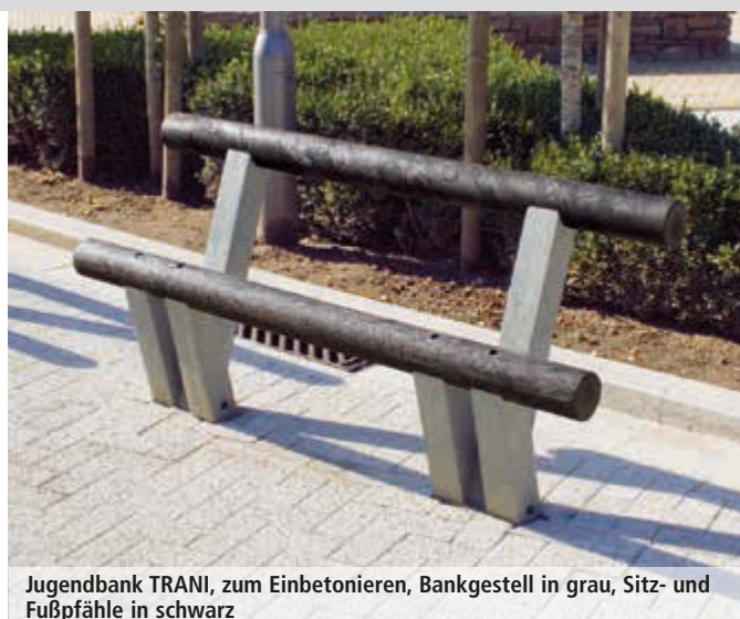
Jugendbank TRANI, zum Einbetonieren, Bankgestell in grau, Sitz- und Fußpfähle in schwarz