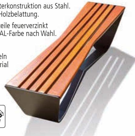
▲ Sitzbank KARMA ohne Rückenlehne, Stahlteile in DB 703 eisenglimmer