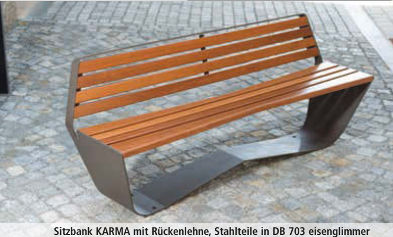
Sitzbank KARMA mit Rückenlehne, Stahlteile in DB 703 eisenglimmer

Konstruktion: Sitzbank mit Unterkonstruktion aus Stahl. Sitzfläche und Rückenlehne mit Holzbelattung.