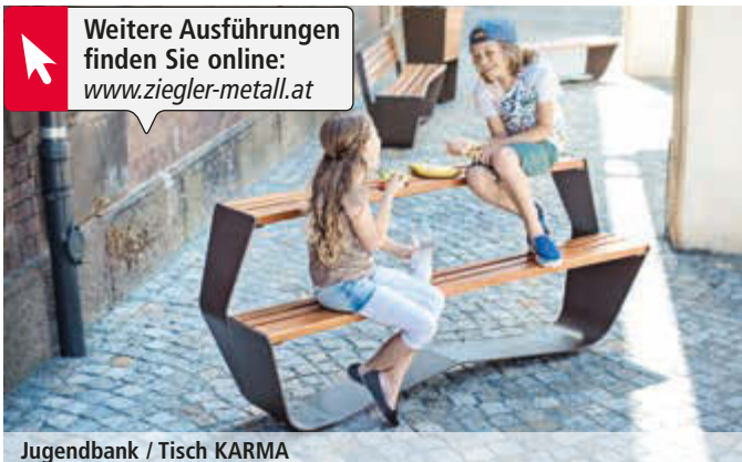
Jugendbank / Tisch KARMA

Weitere Ausführungen finden Sie online: www.ziegler-metall.at