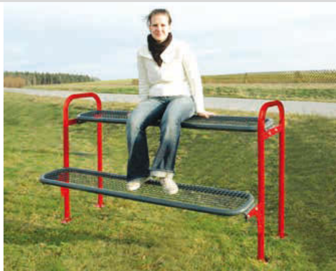
Jugendbank FREAKY mit Drahtgitter, Grundeinheit, in RAL 3000 feuerrot und RAL 7016 anthrazitgrau