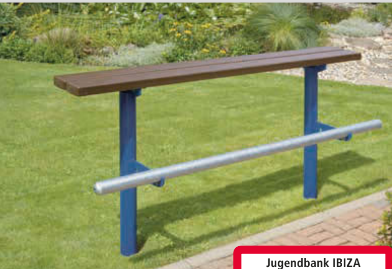
Jugendbank IBIZA, Stahlgestell in RAL 5010 enzianblau

Konstruktion: Jugendbank bestehend aus einem Stahlrohrgestell, Ø 83 mm, zwei Sitzbohlen aus Kunststoff und mit Fußstütze aus Stahl, Ø 60 mm. Recycling-Kunststoffplatten braun durchgefärbt mit Stahlarmierung.