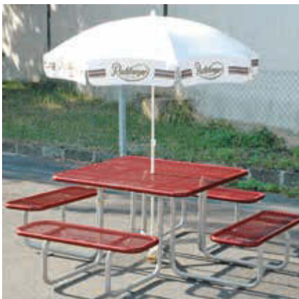
▲ Bank-Tisch-Kombination GRADO (für Erwachsene), Sitz- und Tischfläche in RAL 3005 weinrot, Gestell in RAL 9007 graualuminium