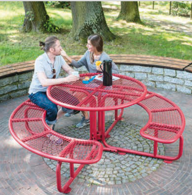
▲ Bank-Tisch-Kombination PAVIA in RAL 3003 rubinrot