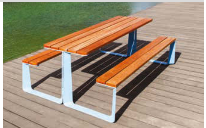
Bank-Tisch-Kombination RAUTSTER, doppelseitig, mit Jatobaholzbelattung, Stahlteile in RAL 5024 pastellblau

Gewindestange M 10 x 200 Stahl galvanisch verzinkt Nr. 122 679 DT € / Stück 2,00 Sie benötigen für die einseitige Ausführung 4 Stück, für die doppelseitige Ausführung 8 Stück pro Bank-Tisch-Kombination.