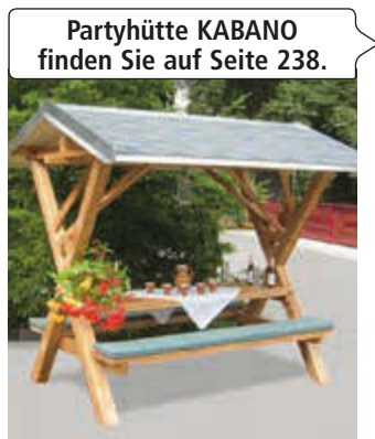
Partyhütte KABANO finden Sie auf Seite 238.