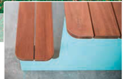
► Bank-Tisch-Kombination WAVER mit Sapeliholzbelattung, Stahlteile in RAL 5021 wasserblau