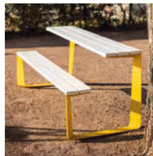
▲ Bank-Tisch-Kombination RAUTSTER, einseitig, mit Kiefernholzbelattung park white, Stahlteile in RAL 1021 rapsgelb