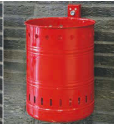
▲ Abfallbehälter NOSTALGIA mit Lochoptik, Inhalt 35 Liter, in RAL 3002 karminrot