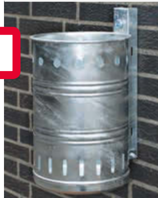
▲ Abfallbehälter NOSTALGIA mit Lochoptik, Inhalt 20 Liter, feuerverzinkt