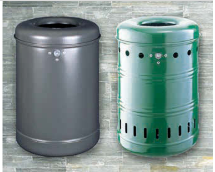
▲ Abfallbehälter BURNABY, Vollblech, in RAL 7016 anthrazitgrau