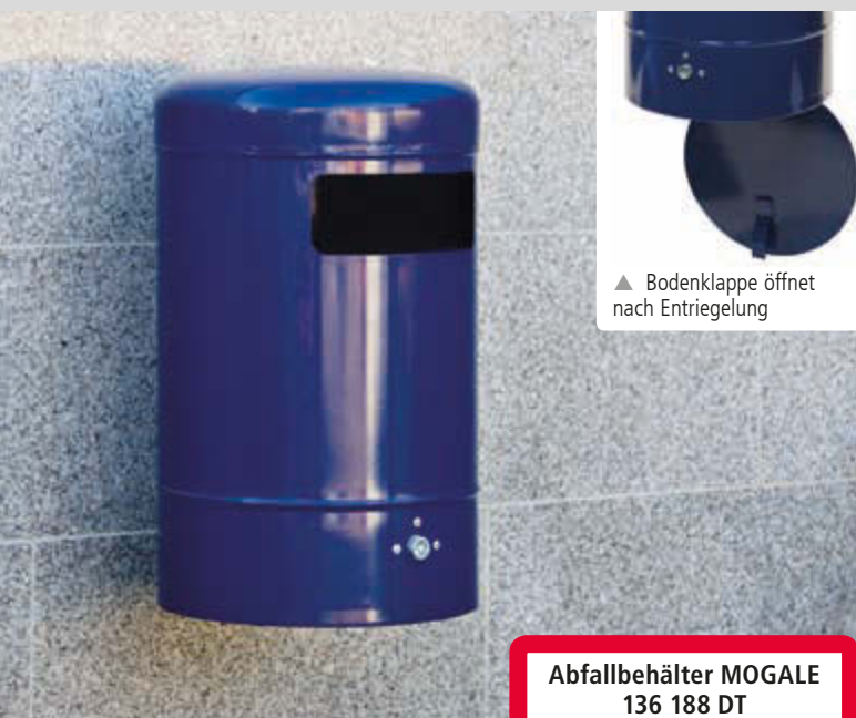
▲ Bodenklappe öffnet nach Entriegelung