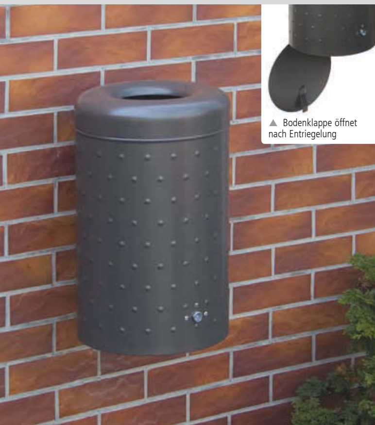
▲ Bodenklappe öffnet nach Entriegelung