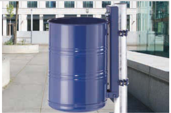
Abfallbehälter NOSTALGIA, Vollblech, 35 Liter, in RAL 5013 kobaltblau, mit Befestigungsschellen-Set (Mehrpreis) befestigt an feuerverzinktem Pfosten (Zubehör)