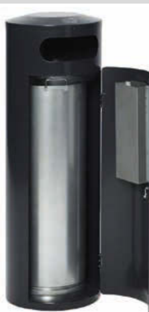
▲ Entleerung von Abfallbehälter AMOS mit Ascher, 90 Liter, in RAL 7021 schwarzgrau