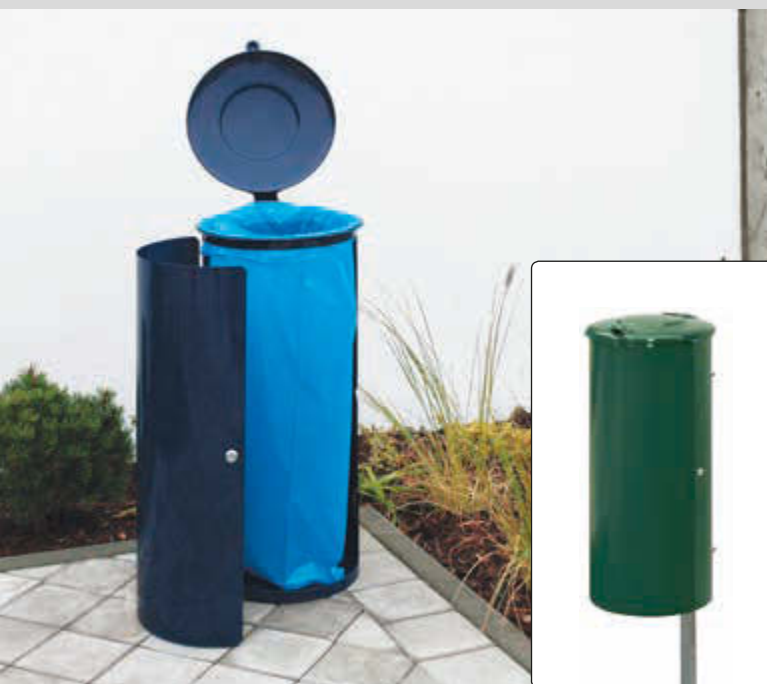
▲ Abfallbehälter NEWPORT, 110 Liter, zum Aufdübeln, in RAL 5013 kobaltblau