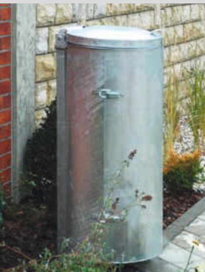
▲ Abfallbehälter SOMERSET, feuerverzinkt, mit Pfosten zum Einbetonieren (Zubehör)