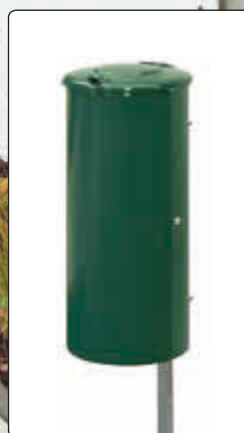
▲ Abfallbehälter NEWPORT, 110 Liter, zum Einbetonieren, in RAL 6005 moosgrün