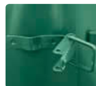
▲ Detail: Bügelverschluss