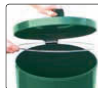
▲ Detail: Deckel geöffnet, Klemmring zur Abfallsackbefestigung

Entriegeln / Entleeren: Behälter mittels Bügelverschluss (ohne Schloss) entriegeln, Tür öffnen und Abfallsack zum Entleeren entnehmen.