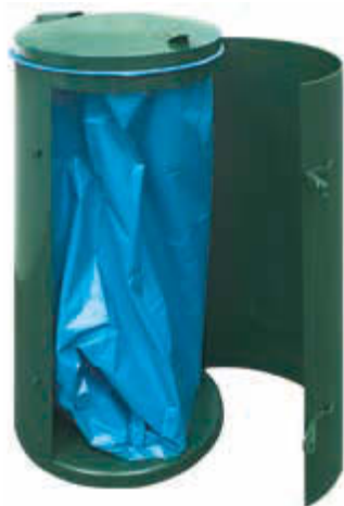
▲ Abfallbehälter SOMERSET, in RAL 6005 moosgrün, zum freien Aufstellen, Tür geöffnet