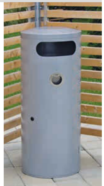
▲ Abfallbehälter AMOS mit Ascher, 70 Liter, in weißaluminium ähnlich RAL 9006