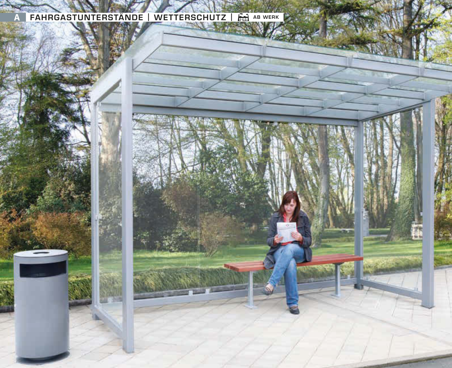
Wartehalle PICTOR, Dachbreite x Dachtiefe 3500 mm x 2250 mm (auftragsbezogene Anpassung), mit Rück- und Seitenwänden ESG, Klarglas, Sitzbank TOBACCO, Abfallbehälter CIMA, Stahlkonstruktion in DB 701 eisenglimmer