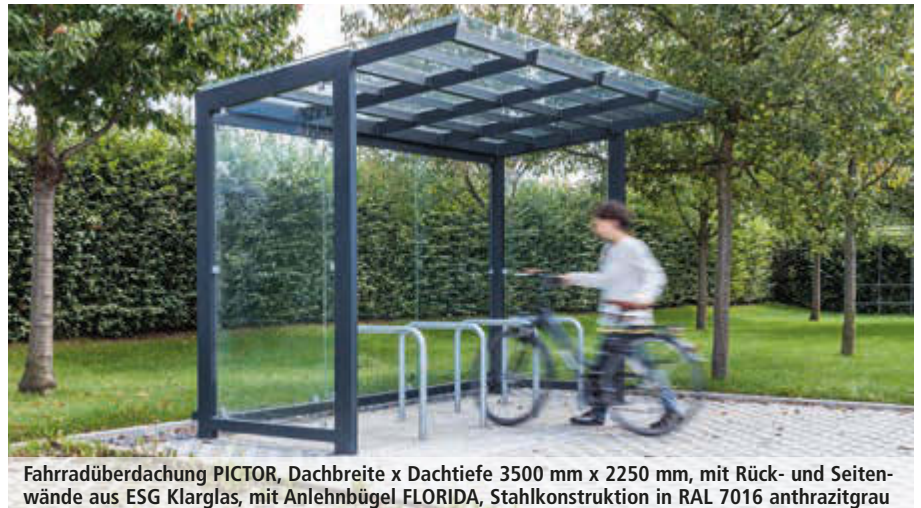
Fahrradüberdachung PICTOR, Dachbreite x Dachtiefe 3500 mm x 2250 mm, mit Rück- und Seitenwände aus ESG Klarglas, mit Anlehnbügel FLORIDA, Stahlkonstruktion in RAL 7016 anthrazitgrau

Bitte fragen Sie an – gerne erstellen wir Ihnen kostenfrei ein individuelles Angebot für Ihr Bauvorhaben: Tel 0800 100 49 01