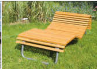
▲ Liegebank RESTING