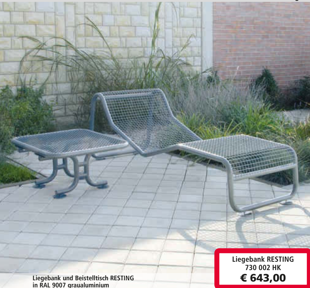
Liegebank und Beistelltisch RESTING in RAL 9007 graualuminium