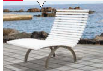
▲ Liegebank TARRY

Weitere Liegebänke finden Sie online unter: www.ziegler-metall.de