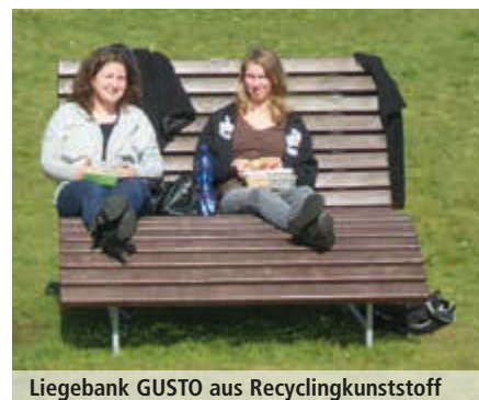
Liegebank GUSTO aus Recyclingkunststoff