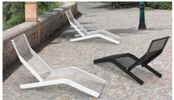
Liegebank RIVAGE zum freien Aufstellen, mit Rundstahlaufgabe in RAL 9010 reinweiß und RAL 7016 anthrazitgrau