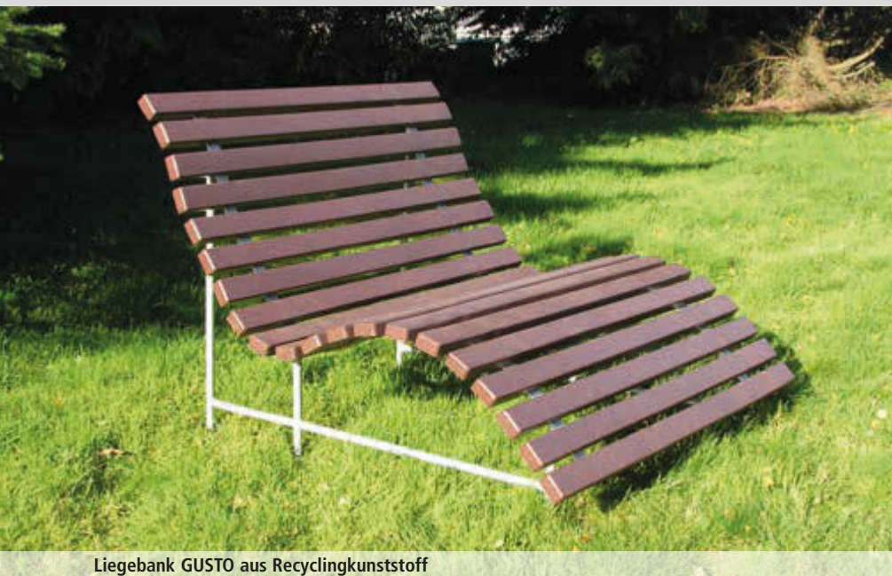
Liegebank GUSTO aus Recyclingkunststoff

Konstruktion: Liegebank mit Unterkonstruktion aus Stahlrohr Ø 27 mm. Liegefläche mit brauner Recycling-Kunststoffbelattung (aus den Sammlungen des Dualen System Deutschland - Grüner Punkt) mit Armierung - gegen Durchbiegung gesichert.