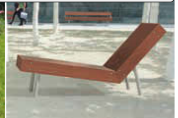
▲ Liegebank WOODY