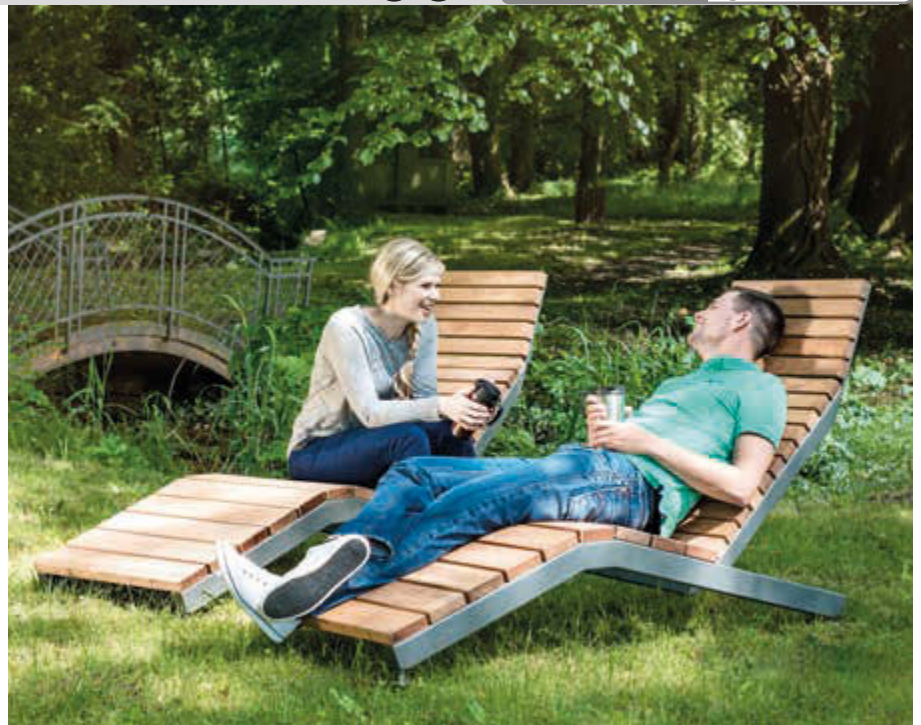
Liegebänke RIVAGE, zum freien Aufstellen, mit Jatobaholzbelattung, Stahlteile in DB 703 eisenglimmer