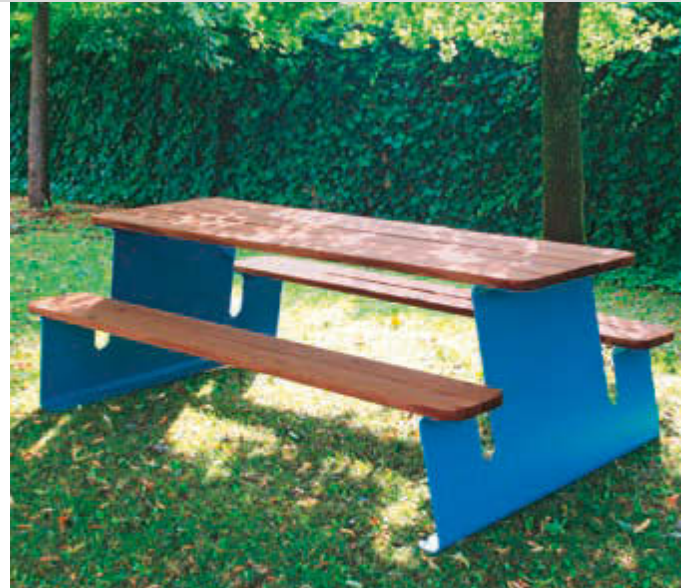
Bank-Tisch-Kombination WAVER mit Sapeliholzbelattung, Stahlteile in RAL 5010 enzianblau

► Bank-Tisch-Kombination WAVER mit Sapeliholzbelattung, Stahlteile in RAL 5021 wasserblau