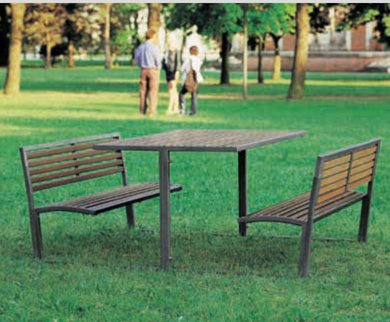
Bank-Tisch-Kombination CAMILLA, Stahlteile in RAL 7016 anthrazitgrau

Konstruktion: Tisch und Sitzbänke sind konstruktiv fest miteinander verbunden. Die gesamte Konstruktion ist 2-teilig verschraubt und besteht aus 30 x 30 mm Quadratrohr. Tischplatte sowie Sitzfläche und Rückenlehne mit Holzbelattung.