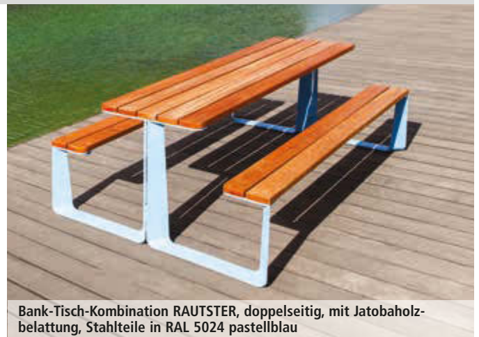
Bank-Tisch-Kombination RAUTSTER, doppelseitig, mit Jatobaholzbelattung, Stahlteile in RAL 5024 pastellblau

Gewindestange M 10 x 200 Stahl galvanisch verzinkt Nr. 122 679 HK € / Stück 1,90 Sie benötigen für die einseitige Ausführung 4 Stück, für die doppelseitige Ausführung 8 Stück pro Bank-Tisch-Kombination.