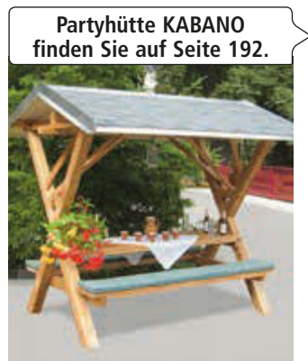
Partyhütte KABANO finden Sie auf Seite 192.

▲ Bank-Tisch-Kombination RAUTSTER, einseitig, mit Kiefernholzbelattung park white, Stahlteile in RAL 1021 rapsgelb