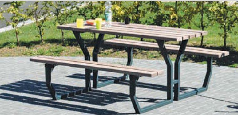
Bank-Tisch-Kombination GLIERA, Stahlteile in RAL 7016 anthrazitgrau