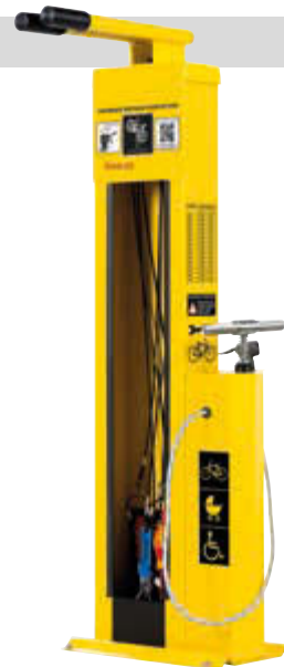
▲ Servicestation ASSIST, Modell „BASIC“