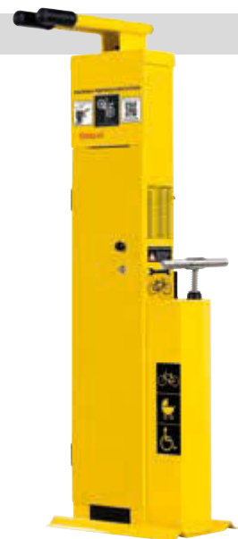
▲ Servicestation ASSIST, Modell „PREMIUM“