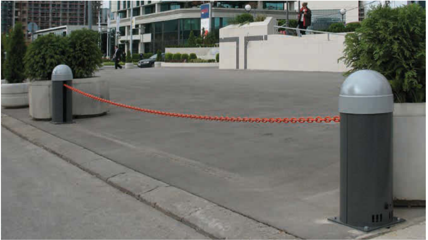
Kettenabsenker LORGUES, in RAL 7016 anthrazitgrau, Pollerkopf in RAL 7035 lichtgrau, Absperrbreite 7 m