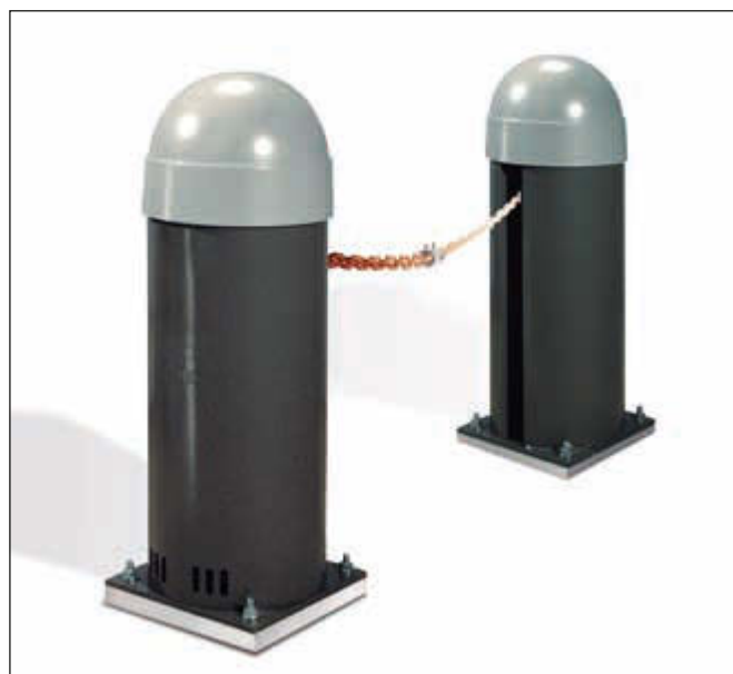
▲ Komplett-Set bestehend aus Säule mit integriertem Motor und Steuerung, Säule mit Gegengewicht und Abwickleinheit, Kette bis 7 m bzw. 15 m je Modell