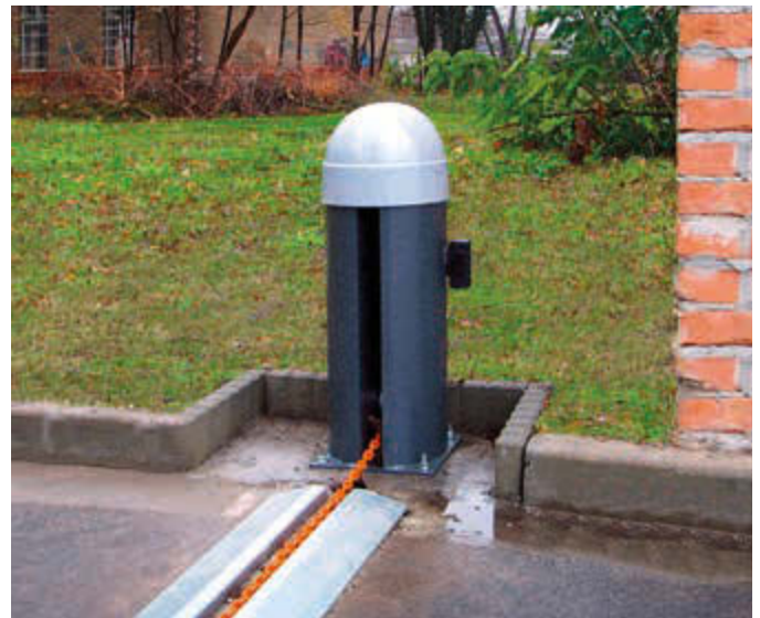
Kettenabsenker LORGUES mit Infrarotschranke und Überflurschiene