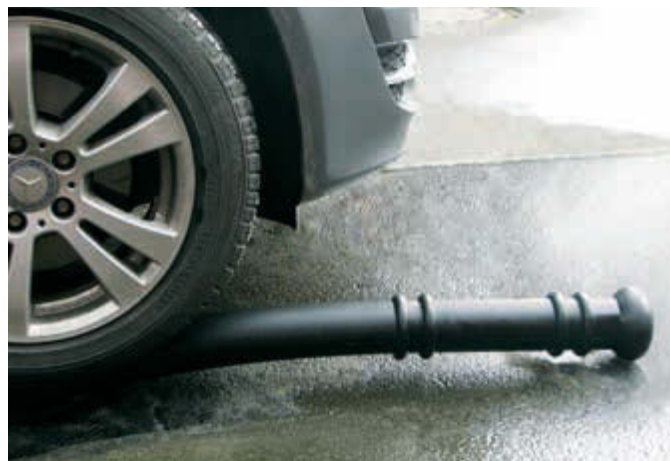
Sperrpfosten ADULAR, bis 90° biegsam