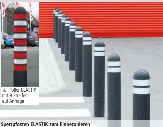
▲ Poller ELASTIK mit 9 Streifen, auf Anfrage

Konstruktion: Runder Sperrpfosten aus vulkanisiertem Gummi.