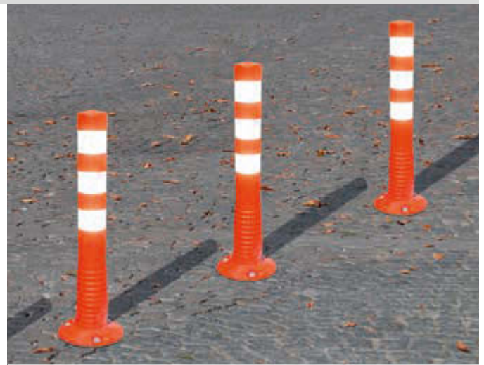
Leitpfosten AGIL in rot mit weißen Reflexstreifen, Höhe 750 mm