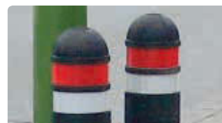
▲ Retroreflexstreifen in weiß und rot (siehe Mehrpreis)