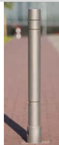
▲ Poller TARANIS mit drei Rillen in DB 703 eisenglimmer