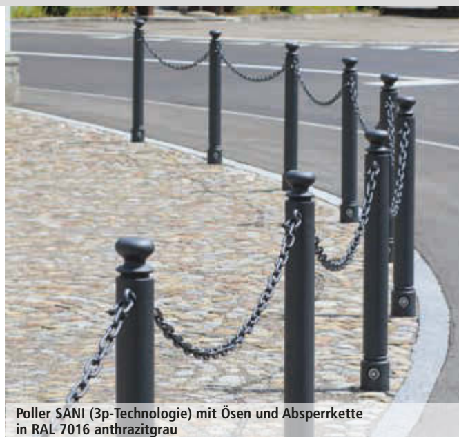
Poller SANI (3p-Technologie) mit Ösen und Absperrkette in RAL 7016 anthrazitgrau