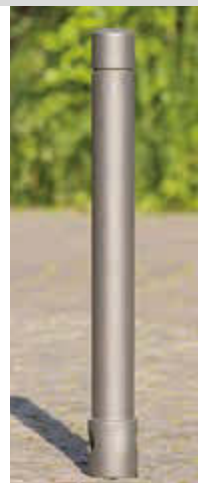
▲ Poller TARANIS mit einer Rille in DB 703 eisenglimmer