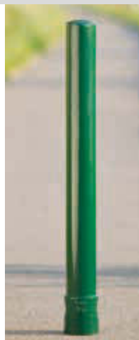
▲ Poller TARANIS ohne Rille in RAL 6009 tannengrün