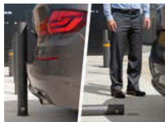
Das austauschbare Verbindungsstück bricht an der Sollbruchstelle (hier: Standardausführung ohne Wegrollsicherung).

Weitere Poller mit 3p-Technologie finden Sie online unter: www.ziegler-metall.de