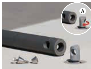
A - Neues Verbindungsstück in Bodenhülse einsetzen und um 90° drehen

ausgezeichnet durch das Design Zentrum NRW mit dem „reddot“ für hohe Designqualität