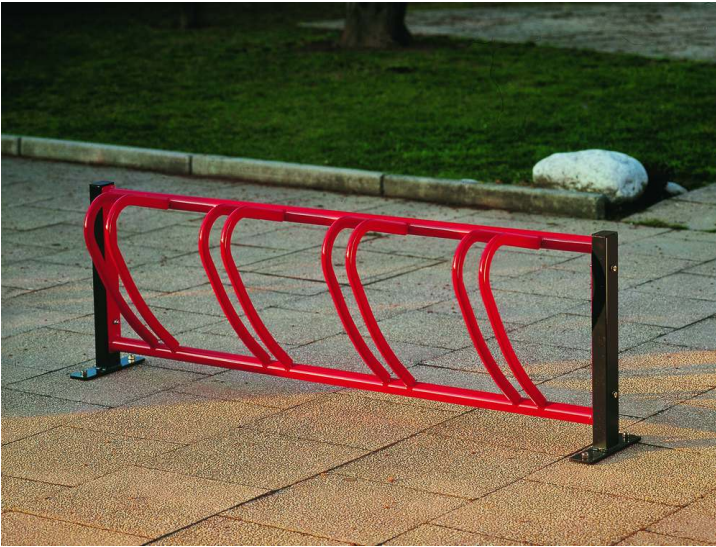
Fahrradständer ATHENA, einseitige Ausführung, in RAL 3000 feuerrot und RAL 7016 anthrazitgrau