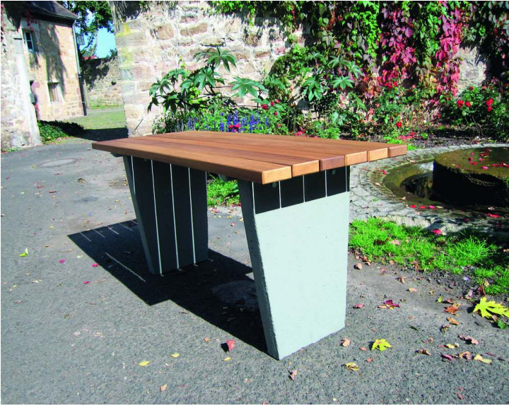
Tisch GENOVA mit Holzbelattung