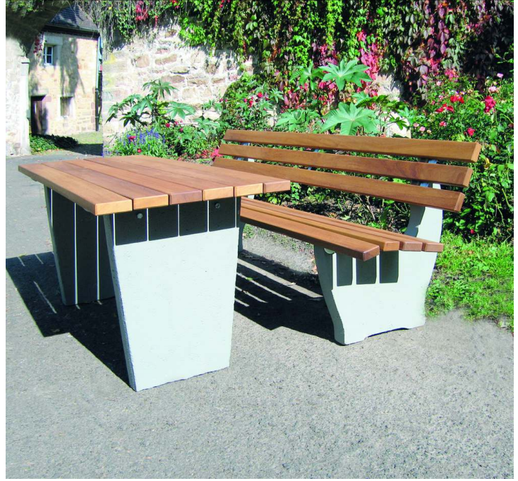
Tisch GENOVA und Sitzbank GENOVA mit Holzbelattung