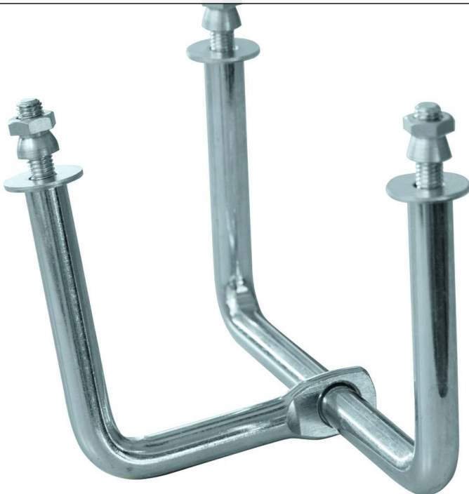
Bodenanker zum Einbetonieren