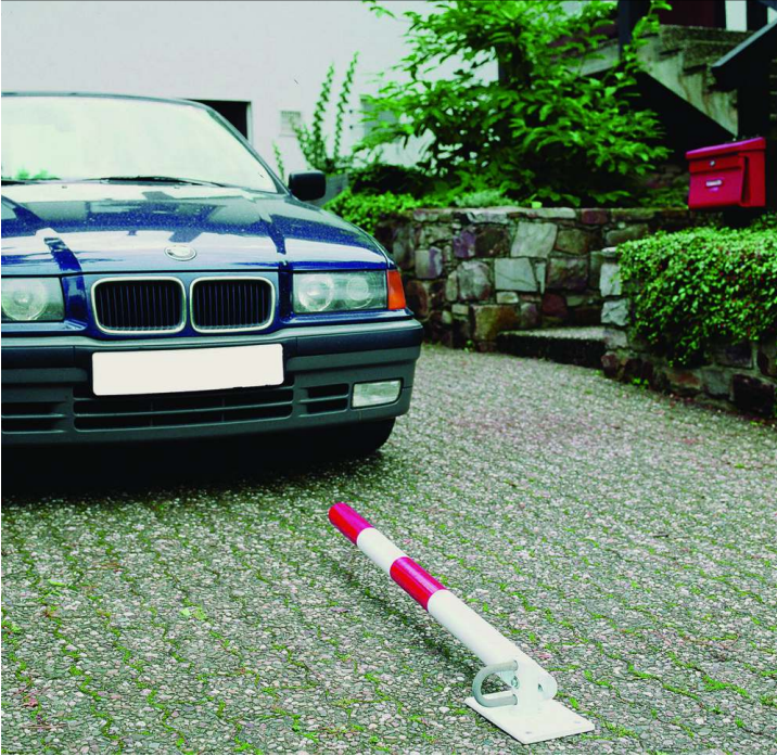
Sperrpfosten IRUN zum Aufdübeln, kippbar