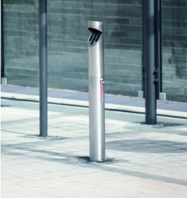
Standascher LENOX zum Aufdübeln, Behälterkopf schräg, aus Edelstahl V2A, geschliffen