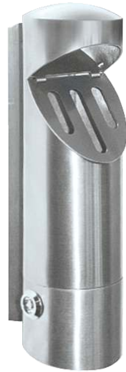
Standascher LENOX zum Aufdübeln, Behälterkopf schräg