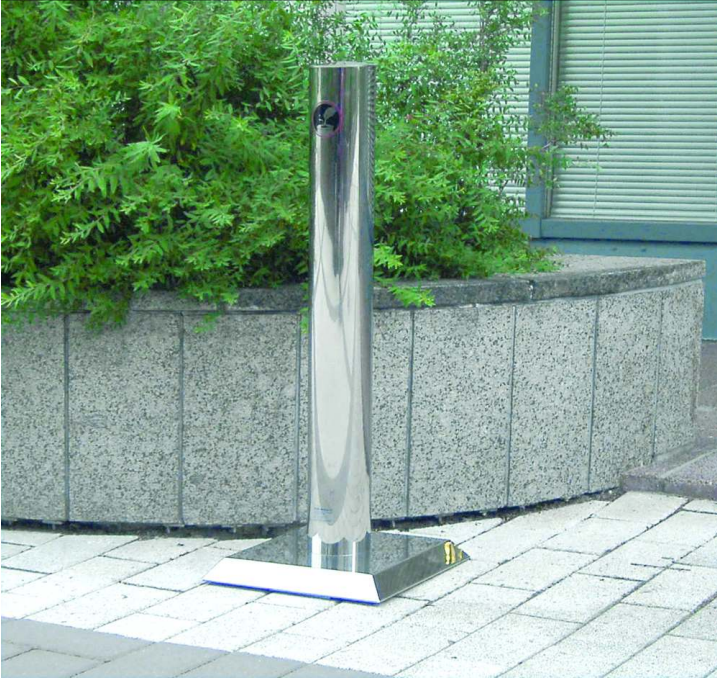
Standascher FINTWIN, 9,1 Liter