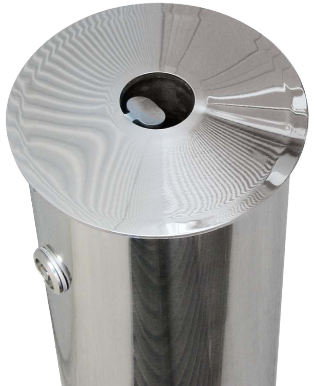
Detail: Kopf 1,8- und 3,7-Liter-Ausführung