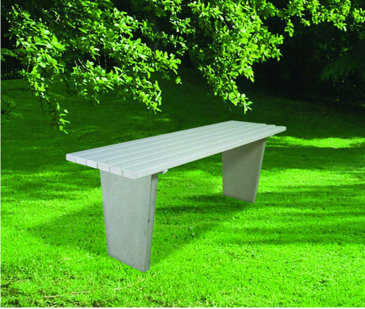
Tisch GENOVA mit PVC-Leisten (Holzeinlage) in weiß