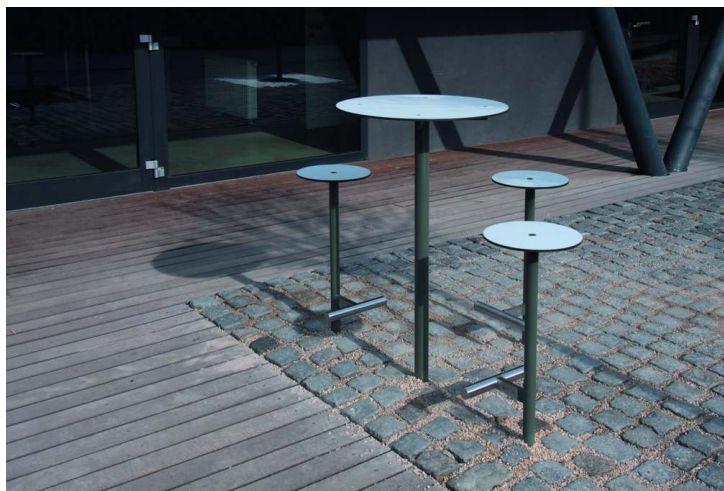
Barhocker und Stehtisch BISTROT mit HPL-Auflage in weiß, Stahlteile in RAL 9007 graualuminium