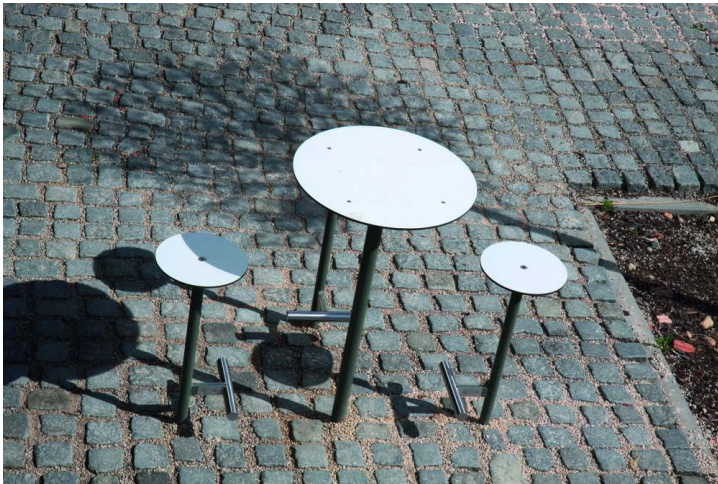
Barhocker und Stehtisch BISTROT mit HPL-Auflage in weiß, Stahlteile in RAL 9007 graualuminium