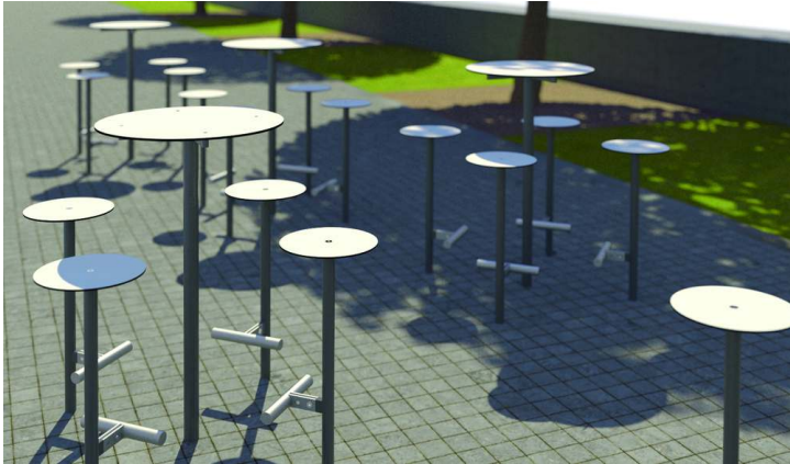
Stehstisch und 4 Barhocker BISTROT, mit HPL-Auflage in weiß, Stahlteile in RAL 9006 weißaluminium