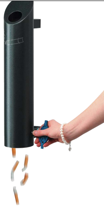
Entleerung vom Wandascher