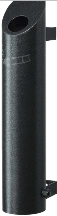
Wandascher LACHUTE, in antik-silber