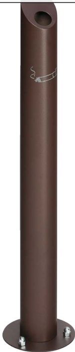
Standascher LACHUTE, in braun