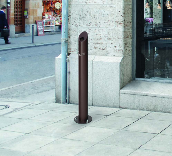
Standascher LACHUTE, in braun