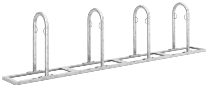
Reihenanlehnbügel ARVADA, 4er-Einheit, feuerverzinkt