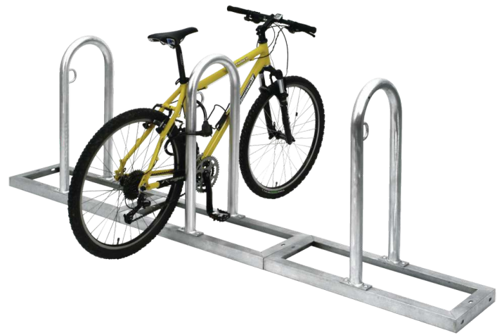
Reihenanlehnbügel ARVADA, 3er-Einheit, feuerverzinkt