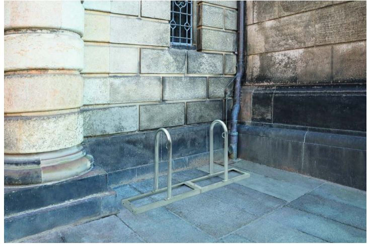
Reihenanlehnbügel ARVADA, 3er-Einheit, feuerverzinkt