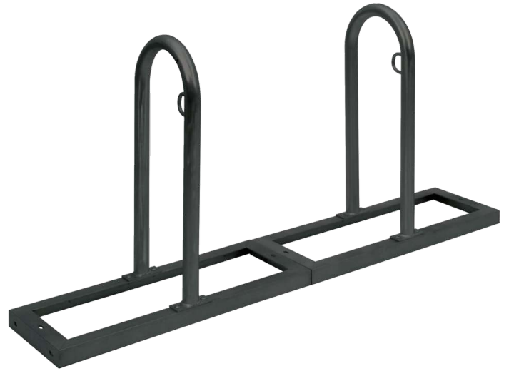
Reihenanlehnbügel ARVADA, 2er-Einheit, in RAL 7016 anthrazitgrau