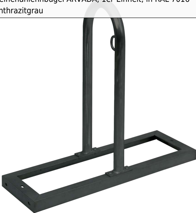
Reihenanlehnbügel ARVADA, 1er-Einheit, in RAL 7016 anthrazitgrau