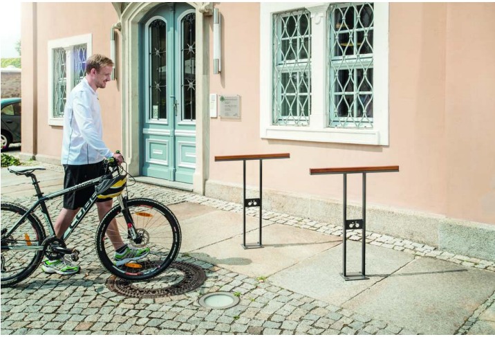
Anlehnbügel SOHA zum Aufdübeln, in RAL 7016 anthrazitgrau