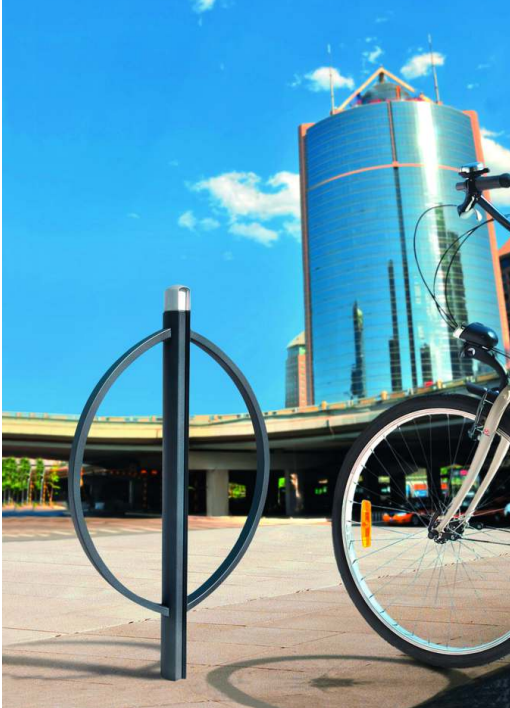
Anlehnbügel ALIZE in RAL 7016 anthrazitgrau