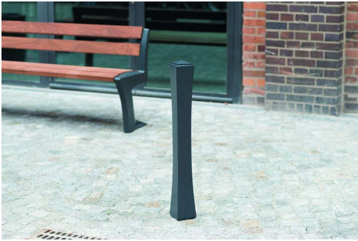
Poller TALLIN in RAL 7016 anthrazitgrau