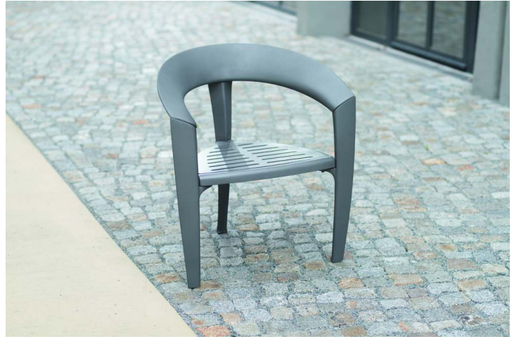
Sitz NASTRA in DB 701 eisenglimmer