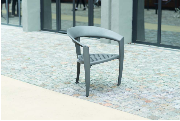
Sitz NASTRA in DB 701 eisenglimmer