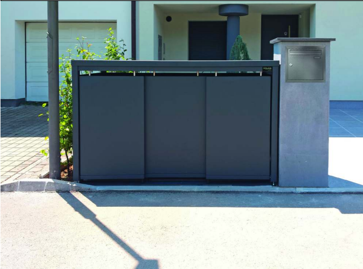
Müllbehälterschrank STYLEOUT® BLANK mit Pflanzdach, Dreifachschränk, Stahlkonstruktion, Dach, Schiebetüren, Rück- und Seitenwände in RAL 7016 anthrazitgrau