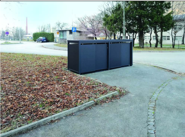
Müllbehälterschrank STYLEOUT® BLANK mit Pflanzdach, Vierfachschrank, Stahlkonstruktion, Dach, Schiebetüren, Rück- und Seitenwände in RAL 7016 anthrazitgrau