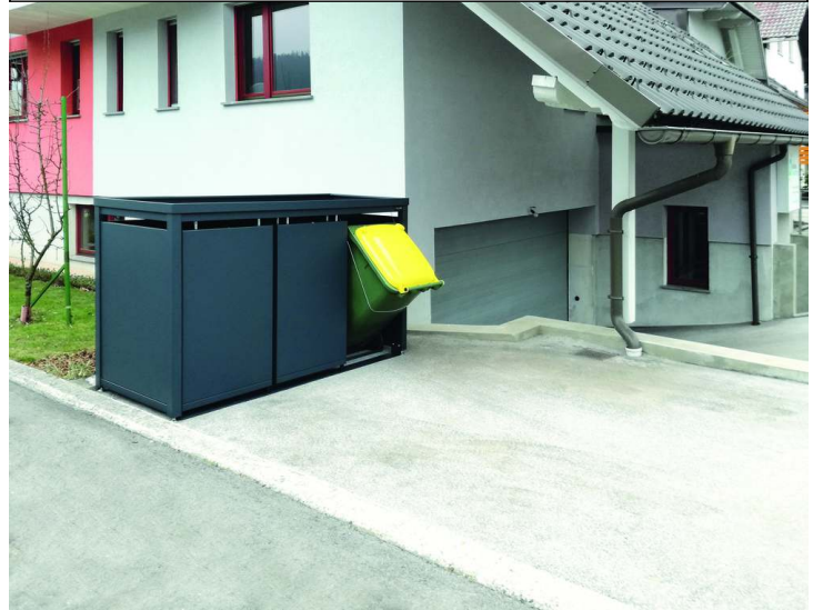
Müllbehälterschrank STYLEOUT® BLANK mit Pflanzdach, Dreifachschrank, Stahlkonstruktion, Dach, Schiebetüren, Rück- und Seitenwände in RAL 7016 anthrazitgrau