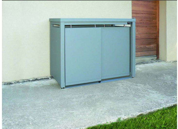
Müllbehälterschrank STYLEOUT® BLANK mit Pflanzdach, Doppelschränk, Stahlkonstruktion, Dach, Schiebetüren, Rück- und Seitenwände in RAL 7005 mausgrau