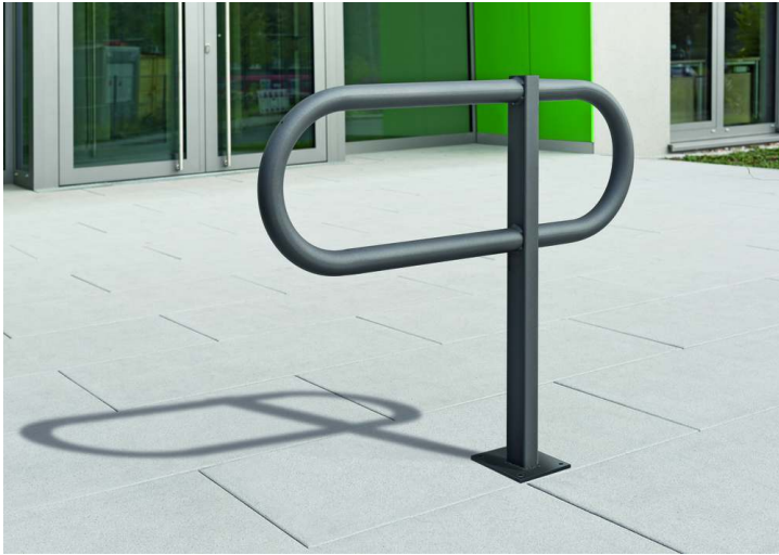
Anlehnbügel HIMOS zum Aufdübeln, in DB 703 eisenglimmer