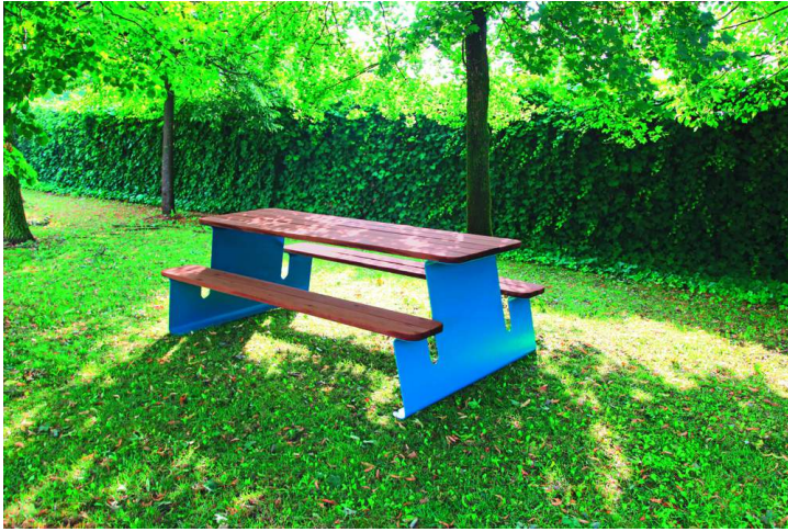
Bank-Tisch-Kombination WAYER mit Sapeliholzbelattung, Stahlteile in RAL 5010 enzianblau