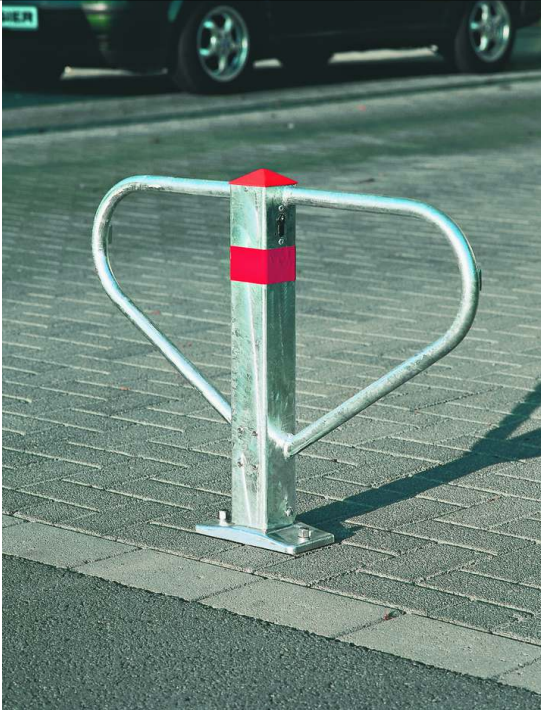
Parkbügel DENIA zum Aufdübeln