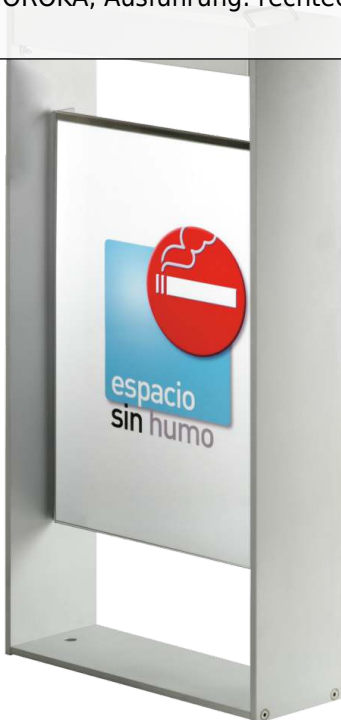
Standascher MOROKA, Ausführung: rechteckig, mit Posterhalter