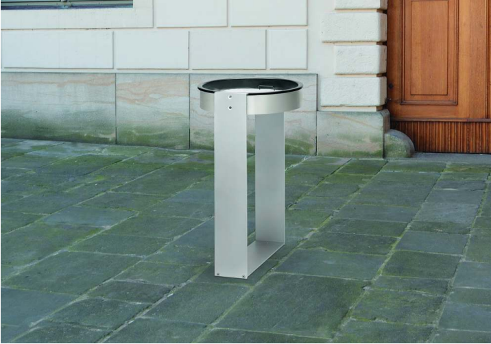
Standascher MOROKA, rund, ohne Posterhalter