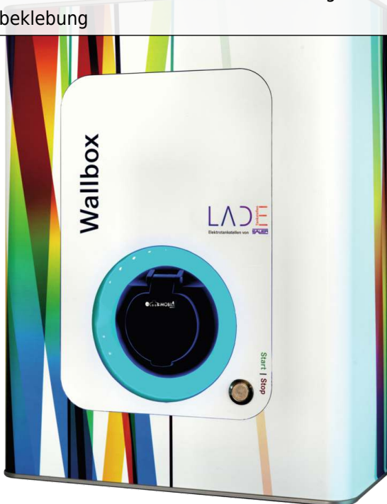
Ladestation WALL-BOX, Standard-Ausführung mit Folienbeklebung