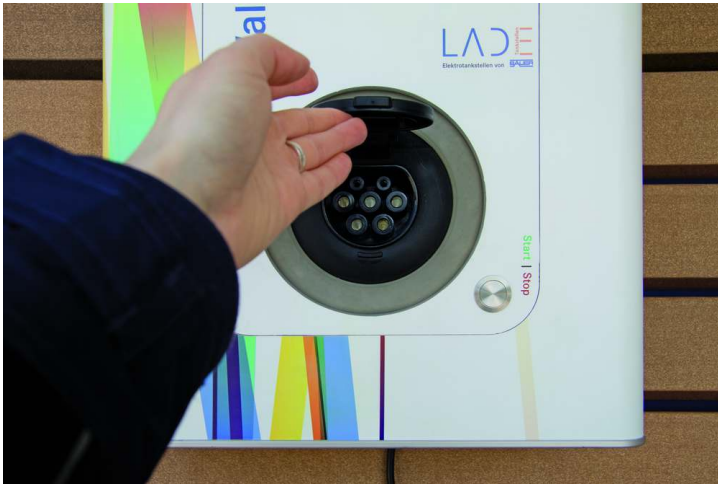
Ladestation WALL-BOX, Standard-Ausführung mit Folienbeklebung