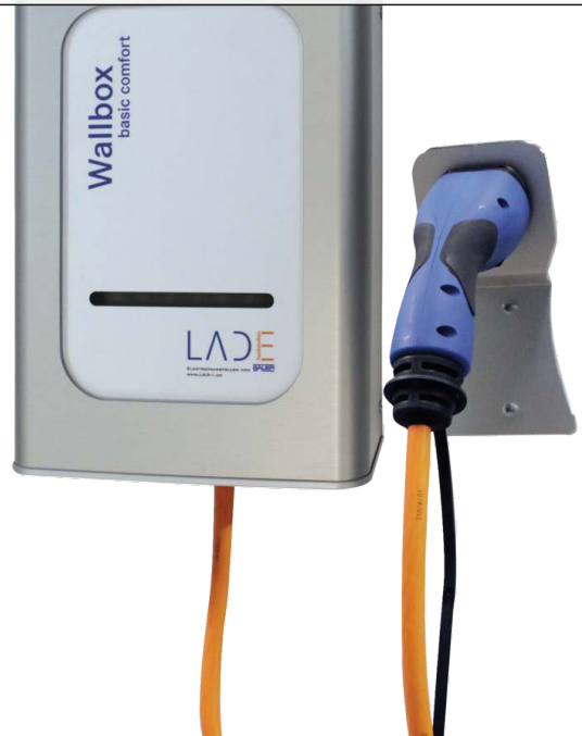
Ladestation WALL-BOX, BASIC mit COMFORT-Ausstattung auf Anfrage