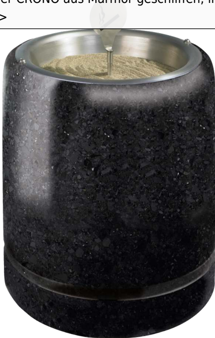
Standascher CRONO aus Marmor geschliffen, in schwarz ebano