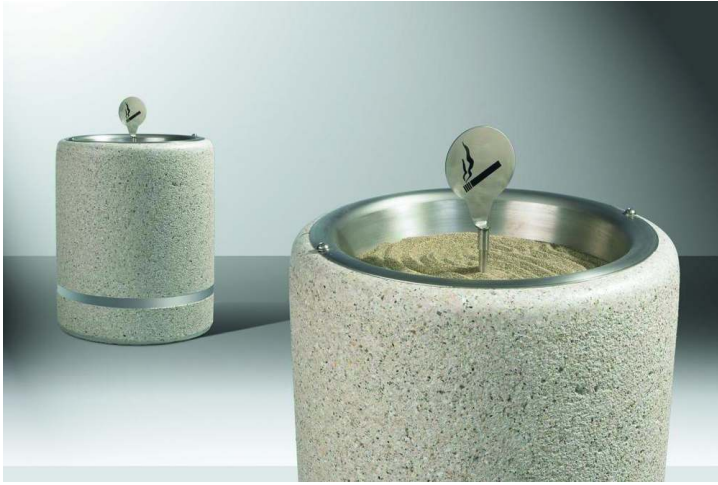
Standascher CRONO aus Beton, gestockt, in Granitoptik weiß