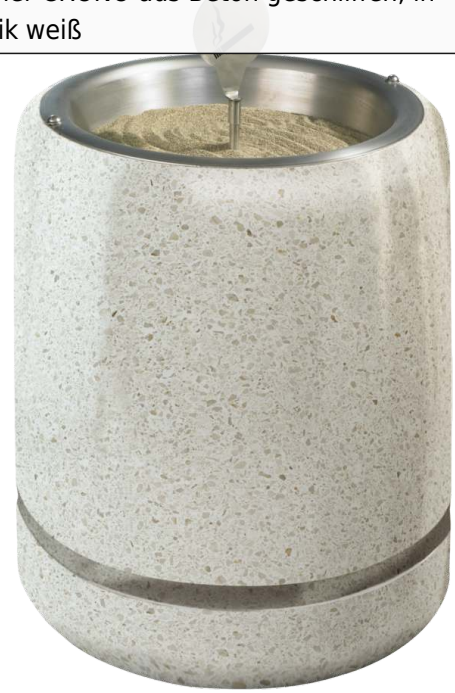
Standascher CRONO aus Beton geschliffen, in Granitoptik weiß