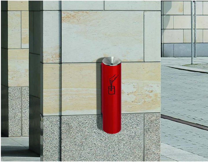
Ascher FERGUS, in RAL 3000 feuerrot