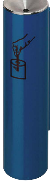
Ascher FERGUS, in RAL 5010 enzianblau