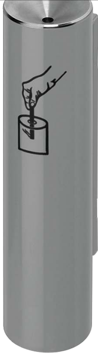
Ascher FERGUS, in weißaluminium ähnlich RAL 9006