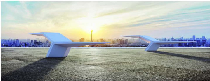
Sitzbank JONATHAN aus UTC®-Beton, in weiß<br>