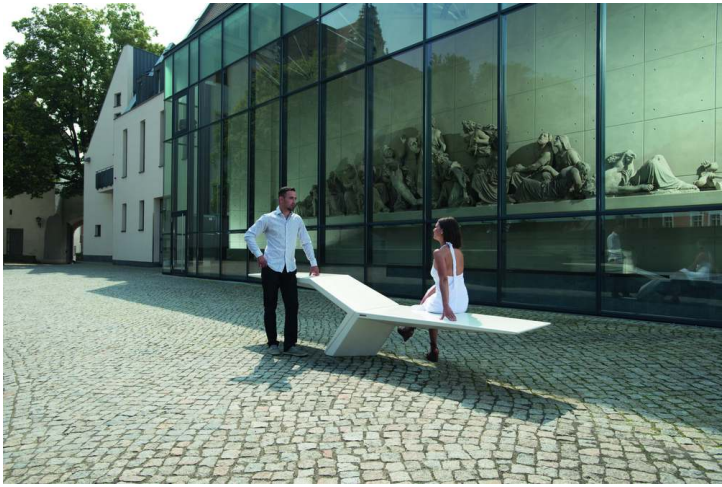
Sitzbank JONATHAN aus UTC®-Beton, in weiß