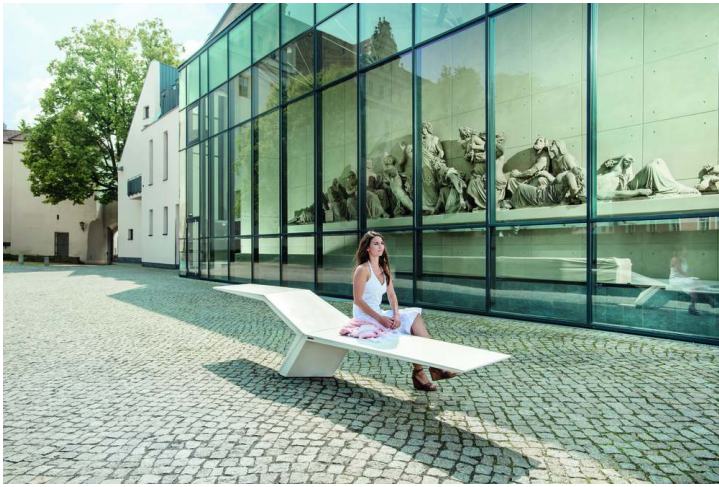
Sitzbank JONATHAN aus UTC®-Beton, in weiß