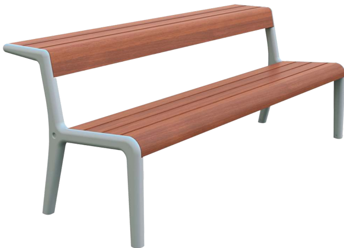
Doppelsitzbank TEO mit Rückenlehne, Gusseisenteile in RAL 7035 lichtgrau