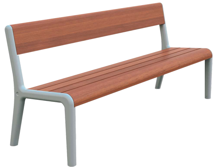
Sitzbank TEO mit Rückenlehne, Gusseisenteile in RAL 7035 lichtgrau