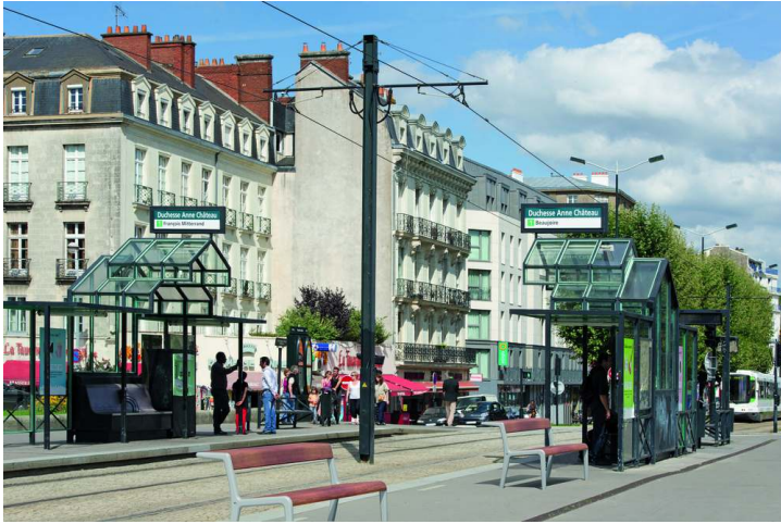
Doppelsitzbank TEO mit Rückenlehne, Gusseisenteile in RAL 7035 lichtgrau