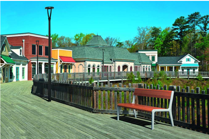
Sitzbank TEO mit Rückenlehne, Gusseisenteile in RAL 7035 lichtgrau