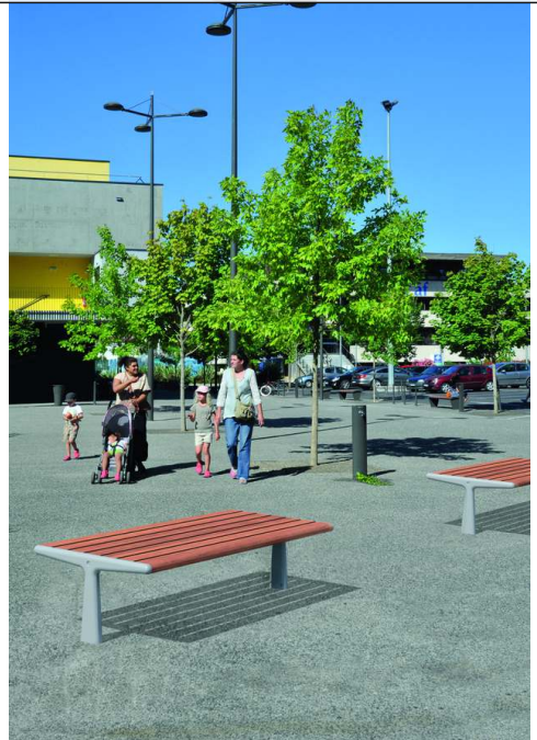
Sitzbank TEO ohne Rückenlehne, Gusseisenteile in RAL 7035 lichtgrau